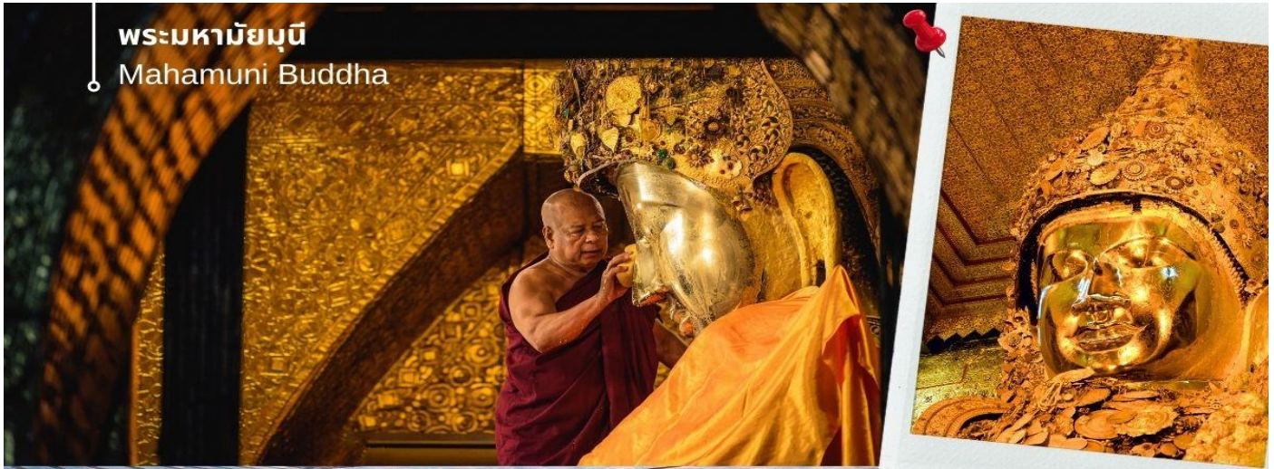
พระมหามัณเฑียร Mahamuni Buddha

เป็นพระพุทธรูปที่มีชีวิต ด้วยเหตุที่ได้รับประทานพร หรือบางตำนานก็กล่าวว่าได้รับประทานลมหายใจจากพระพุทธเจ้า จึงมี ประเพณีล้างพระพักตร์ถวายโดยทุกเช้าในเวลาประมาณ 04.00 น. พระมหากษัตริย์และสาธุชนทั่วไปที่ศรัทธาจะมาทำพิธีล้างพระ พักตร์ด้วยน้ำอบน้ำหอมผสมทานาคาอย่างดี พร้อมกับใช้แปรงทองแปรงที่พระโอษฐ์เสมือนหนึ่งแปรงพระทนต์ถวาย พระพุทธเจ้า ก่อนใช้ผ้าจากศรัทธาสาธุชนที่ถวายมาเช็ดจนแห้งสนิท แล้วนำกลีบคินแก่สาธุชนผู้นั้นไปบูชาต่อ พร้อมใช้พัดทอง โบกถวายเป็นอันดี เสมือนหนึ่งได้อุปัฏฐากองค์สมเด็จพระสัมมาสัมพุทธเจ้าที่ยังทรงพระชนมชีพอยู่ พระมหามัณเฑียรมีอีกพระ นามหนึ่งว่า "พระเนื้อนุ่ม" ซึ่งเกิดจากการปิดทองซ้ำแล้วซ้ำอีกจนเป็นรอยย่นตะปุ่มตะป่ำไปทั่วทั้งองค์ ซึ่งหากเอานิ้วกดลงไปจะ รู้สึกได้ถึงความอ่อนนุ่มของทองคำเปลวที่ปิดทับซ้อนกันนับเป็นพัน ๆ หมื่น ๆ ชั้น สมควรแก่เวลานำท่านเดินทางกลับเข้าสู่ที่พัก