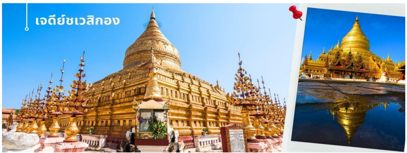
เจดีย์ชเวสิกอง

นำท่านนมัสการ เจดีย์ชเวสิกอง (1 ใน 6 มหาสถานอันศักดิ์สิทธิ์ของชาวพม่า) เชื่อกันว่าเจดีย์ชเวสิกอง เป็นที่ประดิษฐานพระสารีริกธาตุและพระทันตธาตุของพระโคตมพุทธเจ้า พระเจดีย์มีรูปทรงระฆังคว่ำมีการประดับประดาทองคำเปลว ฐานเจดีย์มีหลายชั้น เจดีย์เป็นทรงตัน ฐานระเบียงเจดีย์มีแผ่นภาพเคลือบปูนปั้นเล่าเรื่องในนิทานชาดก ที่ทางเข้าของเจดีย์มีรูปปั้นขนาดใหญ่ของผู้ปกป้องศาสนาสถาน บริเวณโดยรอบล้อมด้วยวิหารและศาลเจ้าขนาดเล็ก นอกจากนี้ยังมีพระพุทธรูปสัมฤทธิ์สี่องค์ของพระพุทธเจ้าในภัทรกัปนี้ทั้งสี่ทิศ ที่ด้านนอกเขตเจดีย์มีวิหารนะ 37 ตน โดยมีท้าวสักกะหรือพระอินทร์เป็นหัวหน้านะ สร้างจากไม้แกะสลักอย่างประณีตตามแบบศิลปะพม่า บริเวณเจดีย์ชเวสิกอง ยังมีเสาหินที่จารึกเป็นภาษามอญในสมัยพระเจ้าจันชิต้า