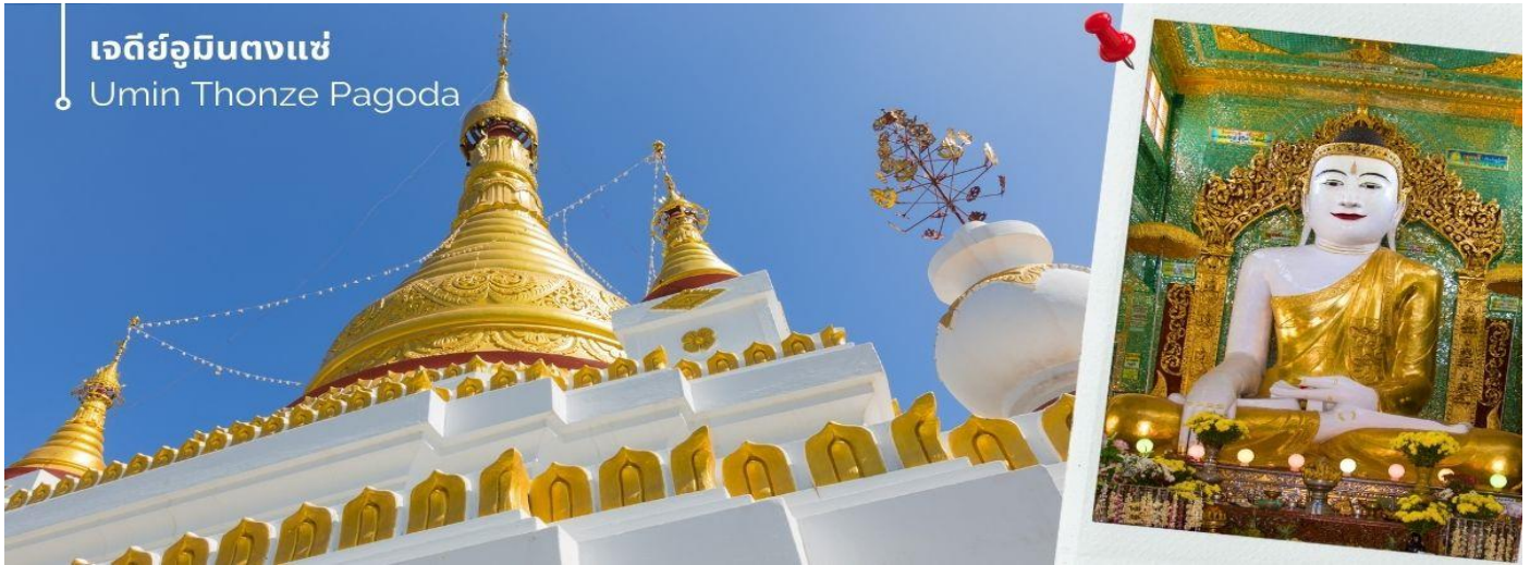
เจดีย์อุมินตงแซ่ Umin Thonze Pagoda

จากนั้นนำท่านชม เจดีย์อุมินตงแซ่ ขอฟร พระทันใจ (Umin Thonze Pagoda) ตั้งอยู่ที่ดอยสุริยะอุมินตงแซ่ อยู่ทางเหนือประมาณ 1200 เมตร เป็นวัดผสมผสานที่มีชื่อเสียงที่สุดคือ ทางเดินรูปพระจันทร์เสี้ยว ภายในมีพระพุทธรูป 45 องค์ ทางเดินรูปพระจันทร์เสี้ยวทั้งหมดมีซุ้มประดับประดาสวยงามทั้งหมด 30 ซุ้ม หมายถึง ถ้ำที่พระสงฆ์นั่งสมาธิ ส่วนชื่อวัด อุมิน แปลว่า ถ้ำ ตงแซ่ หมายถึง 30 ด้าน ด้านข้างทางเดินมีพระวิหารสี่เหลี่ยม ภายในประดิษฐานพระพุทธรูปขนาดต่างๆ กว่าสิบองค์ บนเนินเขาด้านหลังทางเดินยังมีกลุ่มพระอุโบสถและเจดีย์ที่มองเห็นทิวทัศน์ที่สวยงามของภูเขาสุริยะและแม่น้ำอิรวดี