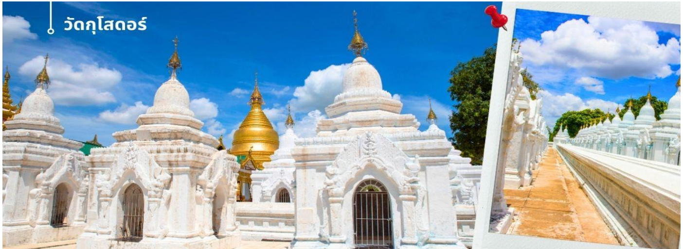
วัดกุสโตร์

ให้สืบเนื่องไปห้าพันปีหลังพระพุทธเจ้า การก่อสร้างเริ่มขึ้นปี พ.ศ. 2403 มีการติดตั้งฉัตรวันที่ 19 กรกฎาคม พ.ศ. 2405 และเปิดให้ประชาชนเข้าชมวันที่ 4 พฤษภาคม พ.ศ. 2411 จาริกถูกจัดเรียงกันเป็นระเบียบภายในกำแพงล้อมสามชั้น ชั้นแรก 42 แผ่น ชั้นสอง 168 แผ่น และชั้นสาม 519 แผ่น อีกแผ่นหนึ่งตั้งอยู่ที่มุมตะวันออกเฉียงใต้ของกำแพงชั้นแรกทำให้ได้ 730 แผ่น หินแผ่นนี้บันทึกประวัติการสร้าง และมีศาลาพักตั้งเรียงรายอยู่รอบ ๆ เจดีย์