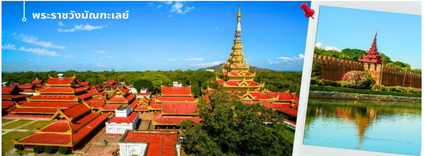
พระราชวังมัณฑะเลย์

อังกฤษเปลี่ยนบริเวณพระราชวังเป็นป้อมดักปืนซึ่งตั้งชื่อตามผู้สำเร็จราชการอินเดียในขณะนั้น ตลอดยุคอาณานิคมของอังกฤษชาวพม่ามองว่าพระราชวังแห่งนี้เป็นสัญลักษณ์หลักของอหิปไตยและอัตลักษณ์ บริเวณพระราชวังส่วนใหญ่ถูกทำลายในช่วงสงครามโลกครั้งที่สองโดยการทิ้งระเบิดของฝ่ายสัมพันธมิตร มีเพียงโรงพยาบาลและหอสังเกตการณ์เท่านั้นที่เหลือรอดพระราชวังจำลองถูกสร้างขึ้นใหม่ในช่วงพ.ศ. 2533 ด้วยวัสดุที่ทันสมัย ปัจจุบันพระราชวังมัณฑะเลย์เป็นสัญลักษณ์หลักของมัณฑะเลย์และเป็นสถานที่ท่องเที่ยวที่สำคัญ