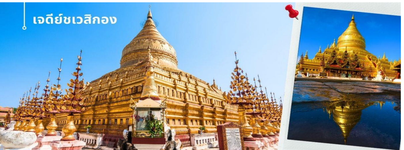
เจดีย์ชเวสิกอง

นำท่านนมัสการ เจดีย์ชเวสิกอง (1 ใน 5 มหาสถานอันศักดิ์สิทธิ์ของชาวพม่า) เชื่อกันว่าเจดีย์ชเวสิกอง เป็นที่ประดิษฐานพระสารีริกธาตุและพระทันตธาตุของพระโคตมพุทธเจ้า พระเจดีย์มีรูปทรงระฆังคว่ำมีการปิดประดับทองคำเปลว ฐานเจดีย์มีหลายชั้น เจดีย์เป็นทรงตัน ฐานระเบียงเจดีย์มีแผ่นภาพเคลือบปูนปั้นเล่าเรื่องในนิทานชาดก ที่ทางเข้าของเจดีย์มีรูปปั้นขนาดใหญ่ของผู้ปกป้องศาสนาสถาน บริเวณโดยรอบล้อมด้วยวิหารและศาลเจ้าขนาดเล็ก นอกจากนี้ยังมีพระพุทธรูปสัมฤทธิ์สี่องค์ของพระพุทธเจ้าในภัทรกัปนี้ทั้งสี่ทิศ ที่ด้านนอกเขตเจดีย์มีวิหารนะ 37 ตน โดยมีท้าวสักกะหรือพระอินทร์เป็นหัวหน้านะ สร้างจากไม้แกะสลักอย่างประณีตตามแบบศิลปะพม่า บริเวณเจดีย์ชเวสิกอง ยังมีเสาหินที่จารึกเป็นภาษามอญในสมัยพระเจ้าจันชิต้า