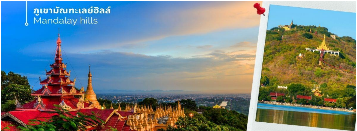
ภูเขามัณฑะเลย์ฮิลล์ Mandalay hills

จากนั้นนำท่านชมทัศนียภาพของเมืองที่ ภูเขามัณฑะเลย์ฮิลล์ (Mandalay hills) ตั้งอยู่ทางตะวันออกเฉียงเหนือจากใจกลางเมืองมัณฑะเลย์ ชื่อเมืองตั้งตามชื่อของเนินเขา เขามัณฑะเลย์ขึ้นชื่อเรื่องเจดีย์และอารามมากมาย และเป็นสถานที่จาริกแสวงบุญที่สำคัญสำหรับชาวพุทธพม่ามาเกือบสองศตวรรษ สักการะสิ่งศักดิ์สิทธิ์ ที่อยู่บนภูเขามัณฑะเลย์รอบวิหารมีระเบียงสำหรับชมทัศนียภาพเมืองมัณฑะเลย์ และสามารถมองเห็นแม่น้ำอิระวดี พระบรมมหาราชวัง วัดกุสโตร์