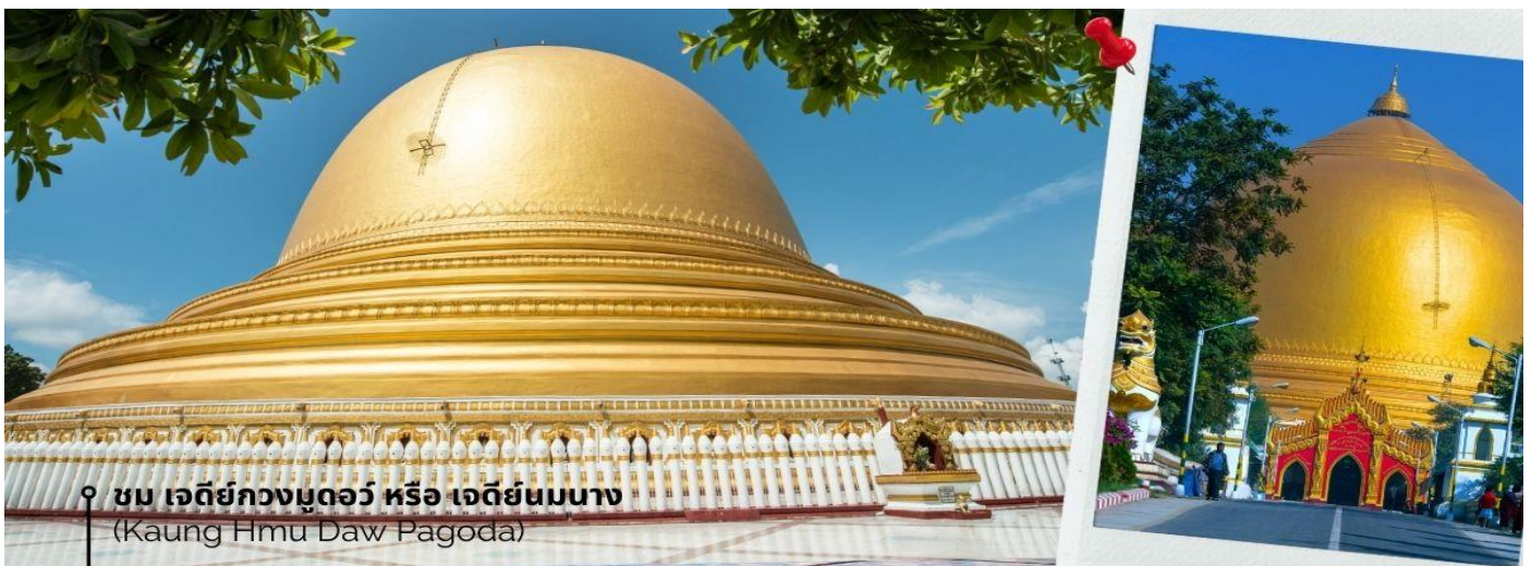
ชม เจดีย์กวางมุดอว์ หรือ เจดีย์นมนาง (Kaung Hmu Daw Pagoda)

นำท่านชม เจดีย์กวางมุดอว์ หรือ เจดีย์นมนาง (Kaung Hmu Daw Pagoda) เป็นเจดีย์พุทธขนาดใหญ่ ตั้งอยู่เขตชานเมืองทางตะวันตกเฉียงเหนือของชะไก้ โดยจำลองตามสัณฐานมาสิมหาเจดีย์ในประเทศศรีลังกา ฐานชั้นล่างสุดของเจดีย์ประดับด้วยนระและเทวดา 120 องค์ ล้อมรอบด้วยคันทิน 802 ต้น ซึ่งแกะสลักพร้อมจารึกพุทธประวัติสามภาษาได้แก่ พม่า, มอญ และไท