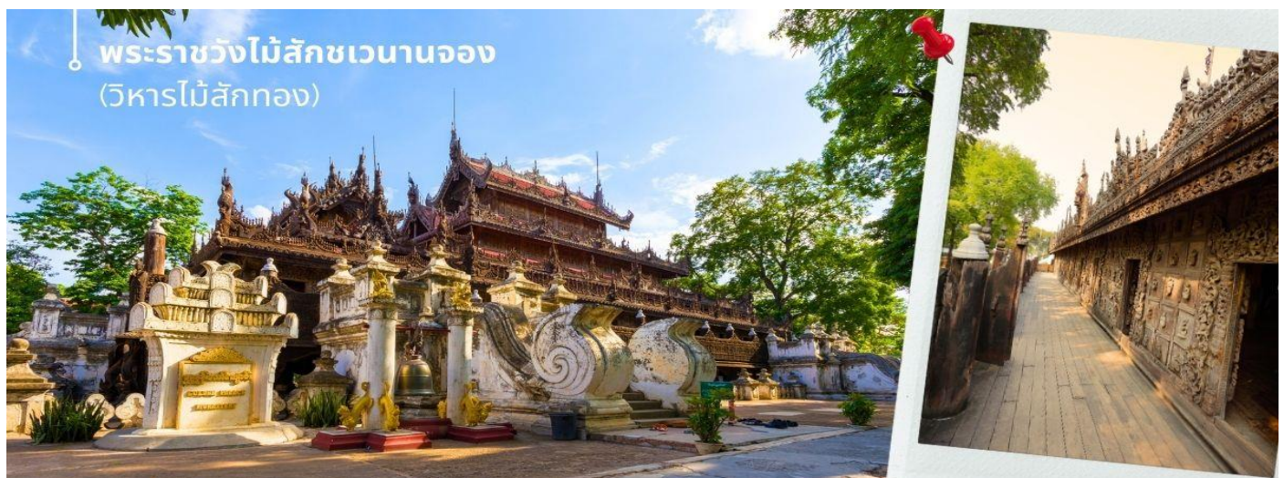
พระราชวังไม้สักขเวนาจอง (วิหารไม้สักทอง)

หากท่านเยี่ยมชม พระราชวังไม้สักขเวนาจอง (วิหารไม้สักทอง) เดิมวิหารหลังนี้เป็นส่วนหนึ่งของพระราชวังอมรปุระก่อนที่จะถูกย้ายมายังมัณฑะเลย์ ซึ่งสร้างในพื้นที่ตอนเหนือของพระราชวังแก้ว และเป็นพระตำหนักประทับส่วนหนึ่งของกษัตริย์ตัวอาคารปิดทองอย่างหนาแน่นและประดับด้วยงานโมเสกแก้ว วิหารแห่งนี้โดดเด่นเรื่องงานไม้สักแกะสลักเรื่องราวทางพุทธศาสนา ซึ่งประดับอยู่ที่ผนังและหลังคา วิหารแห่งนี้สร้างขึ้นในสไตล์สถาปัตยกรรมพม่าแบบดั้งเดิม เป็นอาคารหลักของพระราชวังเดิมเพียงแห่งเดียวที่เหลืออยู่ในปัจจุบัน สร้างขึ้นใน พ.ศ. 2421 โดยพระเจ้าสีป่อ ซึ่งรื้อถอนและย้ายพระตำหนักของพระเจ้ามินดง พระราชบิดาซึ่งครอบครองก่อนสวรรคต พระเจ้าสีป่อได้รื้อพระตำหนักออกเมื่อวันที่ 10 ตุลาคม พ.ศ. 2421 โดยเชื่อว่ามิวิญญาณของพระราชบิดาลังอยู่ การบูรณะวิหารหลังนี้เสร็จสิ้นวันที่ 31 ตุลาคม พ.ศ. 2421 เพื่ออุทิศแด่พระราชบิดา