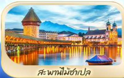
สะพานไมซ์ฮาเปล