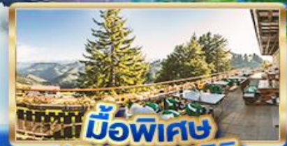
มือพิเศษ บนยอดเขาริค