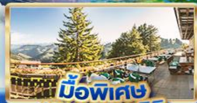
มือพิเศษ บนยอดเขาริวกิ