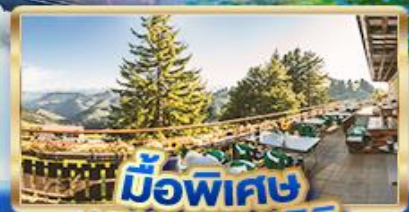
มือพิเศษ บนยอดเขาริวกิ