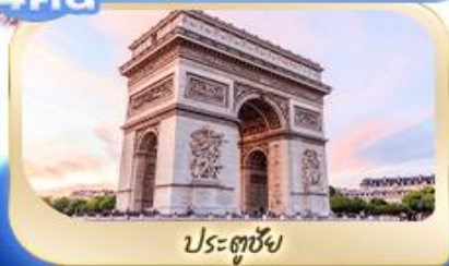
ประตูลุย