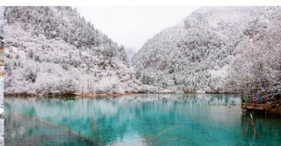
อุทยานแห่งชาติจิวจ้ายโกว