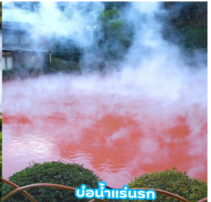
บ่อน้ำแร่รส

GO2FUK-VZ006 – KYUSHU KUMAMOTO OITA SKI WINTER 5D3N VZ