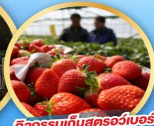
กิจกรรมเก็บสตอว์เบอร์รี่