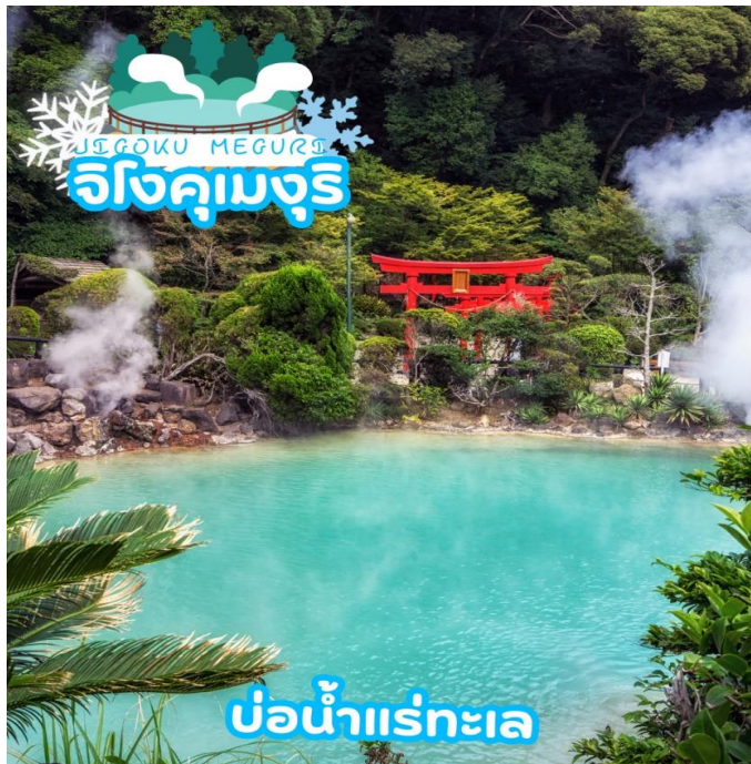
บ่อน้ำแร่ทะเล

ได้เวลาอันสมควรนำท่านเดินทางสู่ เมืองเบปปุ (Beppu) เมืองในจังหวัด โออิตะ (OITA) ตั้งอยู่บนชายฝั่งทะเลตะวันออกของเกาะคีชู ประเทศญี่ปุ่น เป็นเมืองท่องเที่ยวแช่น้ำพุร้อนยอดนิยมของญี่ปุ่น จัดเป็นเมืองที่มีรีสอร์ทน้ำแร่มากที่สุด นักท่องเที่ยวนิยมมาแช่ออนเซนหรืออบทรายร้อนริมทะเลที่เมืองนี้