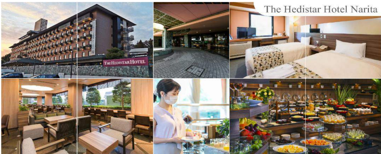
The Hedistar Hotel Narita

THE HEDISTAR HOTEL NARITA หรือระดับเดียวกัน