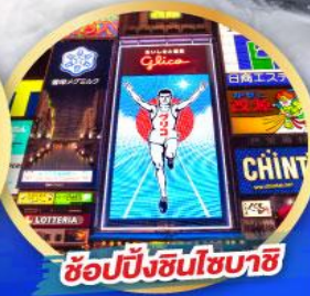
ช้อปปิ้งชินโซบาชิ

เดินทาง 14-19 ม.ค. 68 06-11, 13-18 ก.พ. 68 13-18 มี.ค. 68