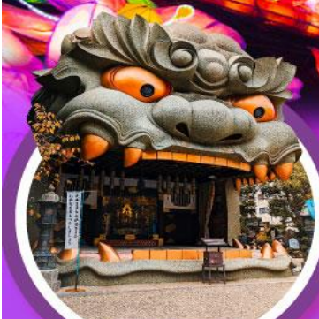
ศาลเจ้านิมมะยาซากะ