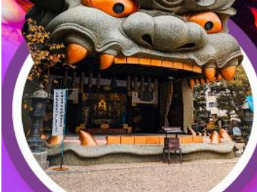
ศาลเจ้านิมมะยาซากะ