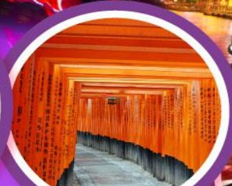
ศาลเจ้าฟุชิมิอินาริ