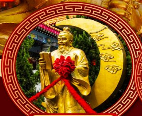
วัดหวังต้าเซียน