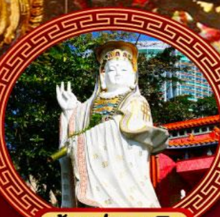
เจ้าแม่กวนอิม ริพัลส์เบย์