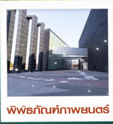
พิพิธภัณฑ์ภาพยนตร์