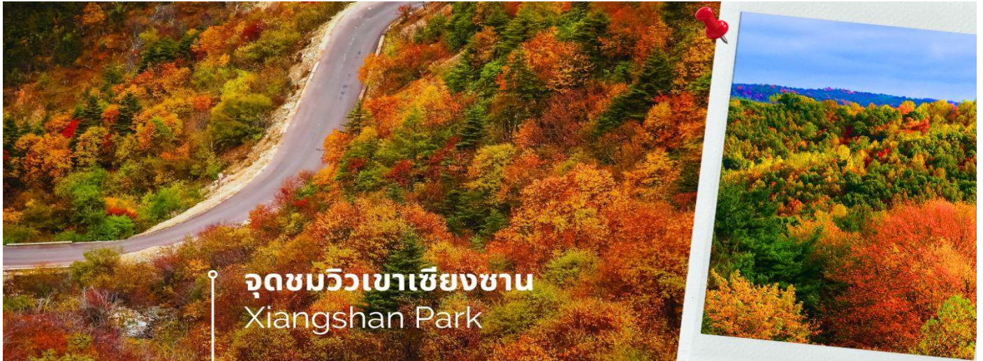
จุดชมวิวกาเซียชางซาน Xiangshan Park

(ระหว่างเดือน ตุลาคม-พฤศจิกายน ของทุกปี) นำท่านชม ใบไม้เปลี่ยนสีที่เชียงซาน จุดชมวิวกาเซียชางซาน (Xiangshan Park) หรือเรียกกันในภาษาอังกฤษว่า Fragrant Hills Park สถานที่ท่องเที่ยวสวยงามในระดับ 4A ตั้งอยู่ในเขตชานเมืองทางตะวันตกของปักกิ่ง เป็น 1 ใน 4 จุดสำหรับชมใบเมเปิ้ลเปลี่ยนสี ใบไม้สีแดงของ