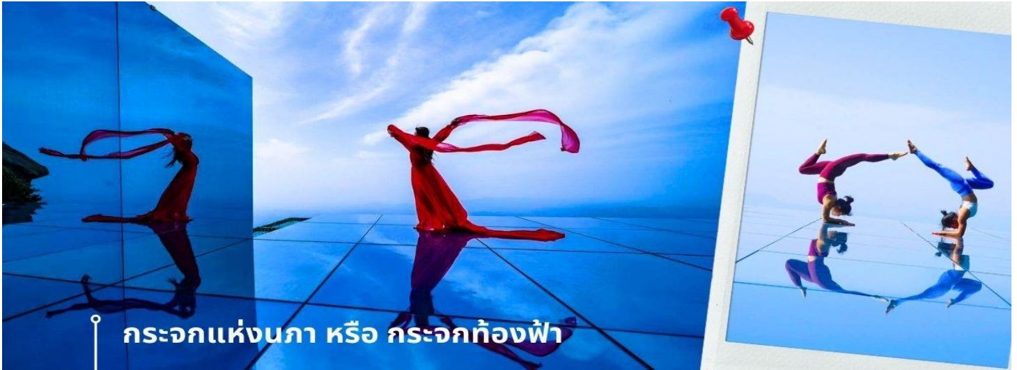
กระจกแห่งเงา หรือ กระจกท้องฟ้า

จากนั้นพาท่านถ่ายภาพความสวยงามของหุบเขาหลิงชาน ในจุดชมวิวและถ่ายภาพที่ได้รับความนิยมจากนักท่องเที่ยวจำนวนมาก นั่นคือ กระจกแห่งเงา หรือ กระจกท้องฟ้า เป็นจุดที่ท่านจะได้ เก็บภาพประทับใจของหุบเขาหลิงชานในมุมที่แปลกตา และน่าตื่นเต้น ด้วยมีลักษณะที่เป็นกระจกเงาสท้อนติดกับเส้นขอบฟ้า และภูเขา ถึงทำให้เกิดภาพที่น่ามหัศจรรย์