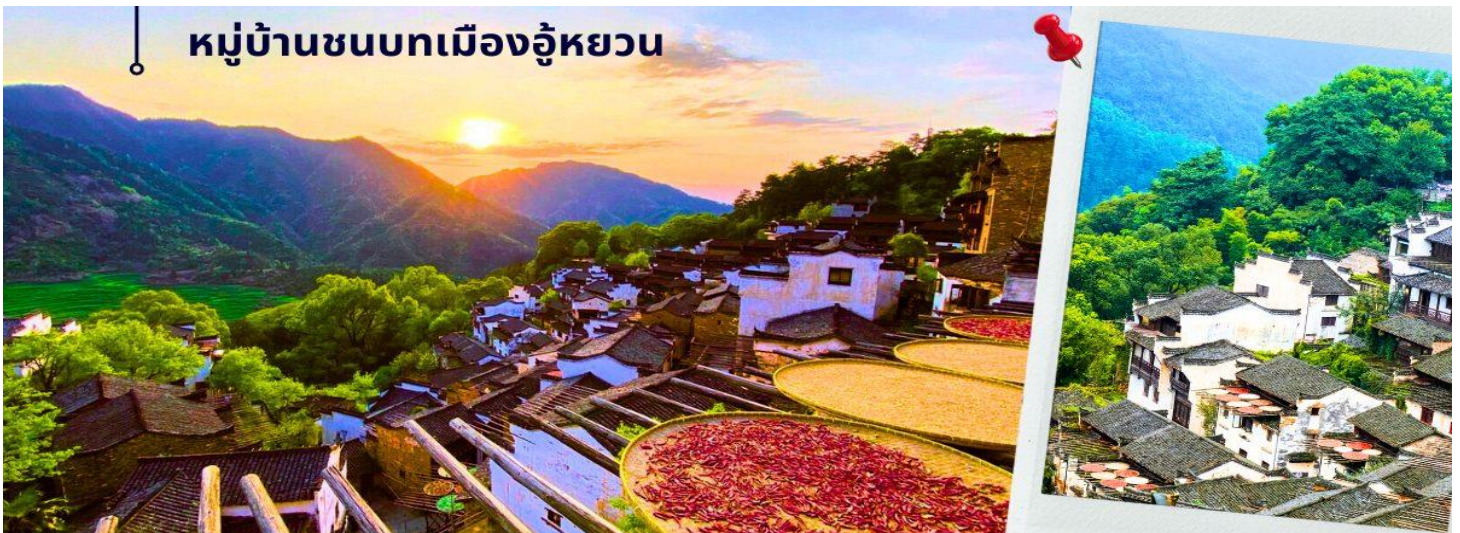
หมู่บ้านชนบทเมืองอู๋หยวน

เที่ยง 10 รับประทานอาหารกลางวัน ณ ภัตตาคาร (3) นำท่านเดินทางสู่ หมู่บ้านชนบทเมืองอู๋หยวน ใช้เวลาเดินทางประมาณ 1.30 ชั่วโมง “เมืองชนบท ที่งดงามที่สุดของประเทศจีน” เป็นเมืองที่ธรรมชาติกลมกลืนกับวิถีชาวบ้านที่เป็นอยู่อย่างเรียบง่ายได้อย่างลงตัว บ้านเก่าแก่ที่อนุรักษ์ไว้อย่างดี สีสันความงามจากธรรมชาติหมุนเวียนไปตามฤดูกาล ทำให้นักท่องเที่ยวได้สัมผัสบรรยากาศที่แตกต่างกันออกไป ตามแต่ฤดูที่มาเยือนเมืองอู๋หยวนแห่งนี้ ซึ่งชาวบ้านยังคงใช้ชีวิตอย่างเรียบง่าย ใช้ชีวิตสบายๆ ริมสายน้ำ ในพื้นที่สีเขียวที่โอบล้อมด้วยภูเขา ด้วยความห่างไกลเมือง และข้อจำกัดเรื่องการเดินทางเข้าถึงในสมัยก่อน ช่วยปกป้องให้อู๋หยวนยังคงรักษาธรรมชาติและวิถีชีวิตแบบดั้งเดิมไว้ได้ แม้ว่าปัจจุบันการเดินทางมาที่อู๋หยวนจะสะดวกสบายขึ้นมาก และการพัฒนายังเข้าถึงทุกหมู่บ้าน แต่โชคดีที่ผู้คนได้เรียนรู้แล้วว่า พวกเขาโหยหาและยังต้องการให้มีหมู่บ้านที่มีบรรยากาศแบบนี้อยู่ต่อไป ดังนั้น อู๋หยวนจึงยังคงความบริสุทธิ์อยู่ได้ ภายใต้กระแสการพัฒนาสมัยใหม่ของจีน