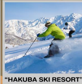
"HAKUBA SKI RESORT"