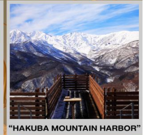
"HAKUBA MOUNTAIN HARBOR"