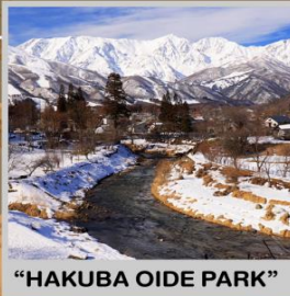
"HAKUBA OIDE PARK"