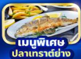
เมนูพิเศษ ปลาเทราต์ย่าง

ชมความสวยงามทะเลสาบลูเซิร์น นั่งรถไฟใต้เขาขึ้นยอดเขารีก นั่งกระเช้าลอยฟ้า ชมความงามของราชินีแห่งขุนเขา เที่ยวหมู่บ้านฮัลส์สตัดท์ พระราชวังเซินบรุนน์ พระราชวังฮอฟบวร์ค มหาวิหารเซนต์สตีเฟน ซ็อบปีงถนน Karntner Strasse เมืองมิวนิก จัตุรัสมาเรียนพลัทซ์ ชมน้ำตกไรน์ น้ำตกที่ใหญ่ที่สุดในยุโรป เมืองลูเซิร์น สะพานไม้ชาเปล อนุสาวรีย์สิงโตสะอื้น เมืองซูริก โบสถ์ฟรอมมุนสเตอร์ โบสถ์กรอสมุนสเตอร์ ถนนบานโฮฟชตราเซอร์ ซ็อบปีงนาฬิกาแบรนต์ตั้งเมืองชุก