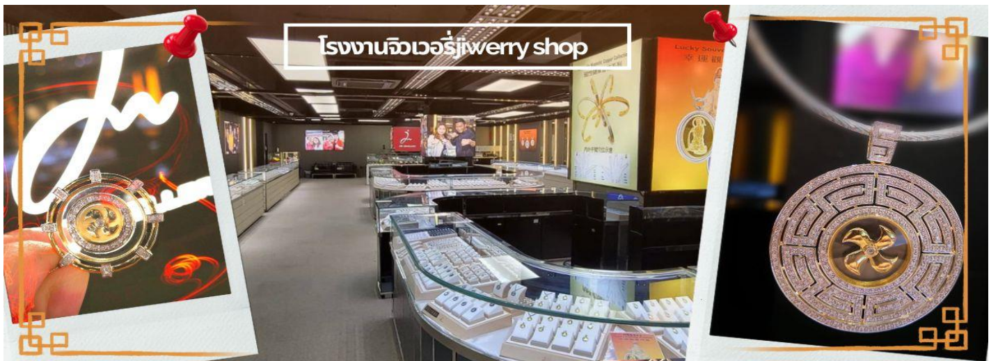
โรงงานจิวเวอรี่jewery shop

จากนั้นนำท่านชม โรงงานจิวเวอรี่ ซึ่งเป็นโรงงานที่มีชื่อเสียงที่สุดของฮ่องกงในเรื่องการออกแบบเครื่องประดับ อาทิเช่น จี้ และแหวนกำหั้น ที่สวยงามโดดเด่นไม่เหมือนใคร ซึ่งถือกำเนิดขึ้นที่นี่และมีชื่อเสียงที่สุดใช้ไปเครื่องประดับติดตัว และเสริมดวงชะตา สินค้าทุกชิ้นมีเอกสารรับประกันคุณภาพเปลี่ยน ซ่อม ได้ตลอดอายุการใช้งาน หากเกิดการชำรุดจากสินค้าไม่ใช่อุบัติเหตุ