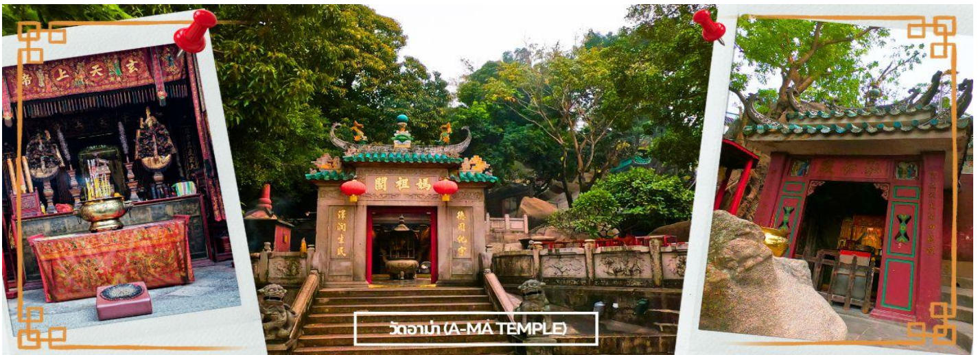
วัดอามา (A-MA TEMPLE)

จากนั้นนำท่านสู่ วัดอามา (A MA TEMPLE) หนึ่งในวัดสำคัญ ศักดิ์สิทธิ์ และเก่าแก่ที่สุดของมาเก๊า คนไทยคุ้นหูในชื่อ ศาลเจ้าแม่ทับทิม โด่งดังในการขอพรเรื่องหน้าที่การงาน การเงิน และความเป็นสิริมงคลแก่ชีวิต ใครที่ไปกราบไหว้ บูชา กลับมาชีวิตในการทำงาน การเงินก็จะดีขึ้น มีเทพศักดิ์สิทธิ์องค์ต่างๆ ซึ่งผลสานความเชื่อทางพุทธศาสนา ลัทธิเต๋า คติความเชื่อพื้นบ้าน วัฒนธรรมประเพณี และความศรัทธา โดยตัววัดมีความเก่าแก่อย่างมาก ทำให้มีคุณค่าทางประวัติศาสตร์ จึงทำให้วัดแห่งนี้ กลายเป็นหนึ่งในสถานที่ ที่กำหนดไว้ในศูนย์ประวัติศาสตร์แห่งมาเก๊า แต่เดิมเชื่อกันว่าที่มาของชื่อ มาเก๊า มาจากบริเวณวัดอามาแห่งนี้เอง โดยในอดีตจะมีอ่าวที่ชื่อว่า อามา ก๊อ ก แปลว่า อ่าวของอามา จึงเพี้ยนมาเป็นชื่อ มาเก๊า ในปัจจุบันนั่นเอง ต่อมาในปี 2005 วัดอามา มาเก๊า ได้รับการขึ้นทะเบียนให้เป็นมรดกโลกโดย UNESCO ซึ่งตัววัดเองมีตำนานเล่าว่า มีเด็กสาวชื่อว่า หลินโม ซึ่งเป็นเด็กที่เฉลียวฉลาด สามารถยังรู้ถึงความเจ็บไข้ได้ป่วยของผู้อื่น อยู่มาวันหนึ่ง หลินโม มีความคิดอยากจะข้ามมายังคาบสมุทรอ่าวเหมิน จึงขอติดเรือไปกับคนอื่นที่อยากข้ามฝั่งด้วยเช่นกัน แต่มีเหตุการณ์ไม่คาดคิด เกิดพายุโหมกระหน่ำ ทำให้เรือหลายลำที่เดินทางไปด้วย กันจมลงสู่ใต้ท้องทะเล ยกเว้นเรือที่มีหลินโม จนทำให้สามารถที่สามารถเดินทางถึงฝั่งได้โดยสวัสดิภาพ และต่อมาเธอก็ได้มาเสียชีวิตลงบริเวณอ่าว A Ma วิญญาณของเธอก็มักจะ