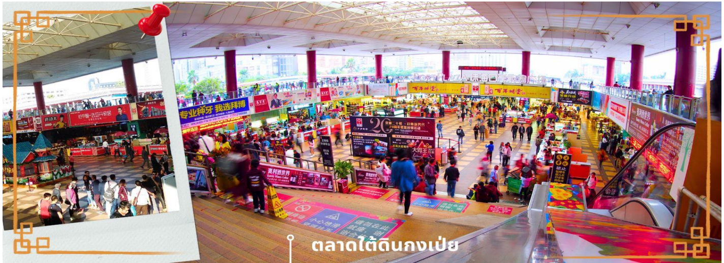
ตลาดใต้ดินกงเป๋ย

จากนั้นนำท่าน อิสระช้อปปิ้งตลาดใต้ดินกงเป๋ย ตั้งอยู่ติดชายแดนมาเก๊า เป็นศูนย์การค้าติดแอร์ ที่มีร้านค้ามากกว่า 5,000 ร้านค้า มีสินค้าให้ท่านเลือกมากมาย เช่น สินค้าก๊อปปี้แบรนด์เนมต่างๆ ไม่ว่าจะเป็นเสื้อผ้า รองเท้า กระเป๋า นาฬิกา ของเด็กเล่น ฯลฯ ที่มีสินค้าให้เลือกซื้อหลากหลาย จึงเป็นที่นิยมมากของชาวมาเก๊า และฮ่องกง เนื่องจากสินค้าที่นี่มีคุณภาพและราคาถูก