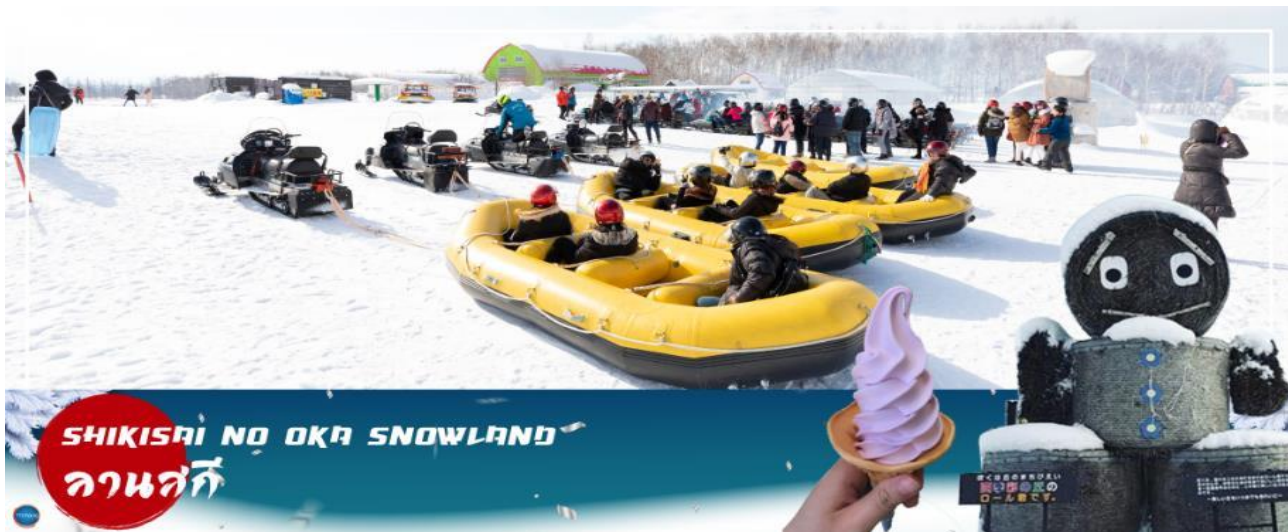
SHIKISAI NO OKA SNOWLAND ลานสกี

นำท่านสู่ ลานสโนว์ เวิลด์ซิดิไซพาโนรามา (Shikisai no oka) เนินที่ราบกว้างใหญ่ที่มีโรลคองและโรลจิ้ง เป็นหุบฟางขนาดใหญ่ ซึ่งเป็นสัญลักษณ์ของลานแห่งนี้ ท่านสามารถสนุกสนานกับลานกิจกรรมที่มีบริการอยู่ที่นี้ ทั้งแบบ Snow Raft เรือยางขนาดใหญ่ที่สามารถนั่งเป็นกลุ่ม หรือเดี่ยว ไหลลงจากเนินตามเนินเขาที่กำหนด และยังมี Banana Boat ที่ลากด้วยสโนว์โมบิลที่ลากซึกแซกตามสันเนินสร้างความสนุกสนานตื่นเต้นได้มากเลยทีเดียว และ Sled สำหรับพาหorses ส่วนตัว ที่ไหลลงจากเนินสูง (**หมายเหตุ ราคาไม่รวมค่าเล่นกิจกรรมต่างๆ ค่าเช่าชุดและอุปกรณ์ กรณีลานสโนว์เวิลด์ปิด บริษัทสงวนสิทธิ์ นำลูกค้าไปลานสโนว์ เวิลด์อื่นแทนได้ตามความเหมาะสมกับสถานการณ์)