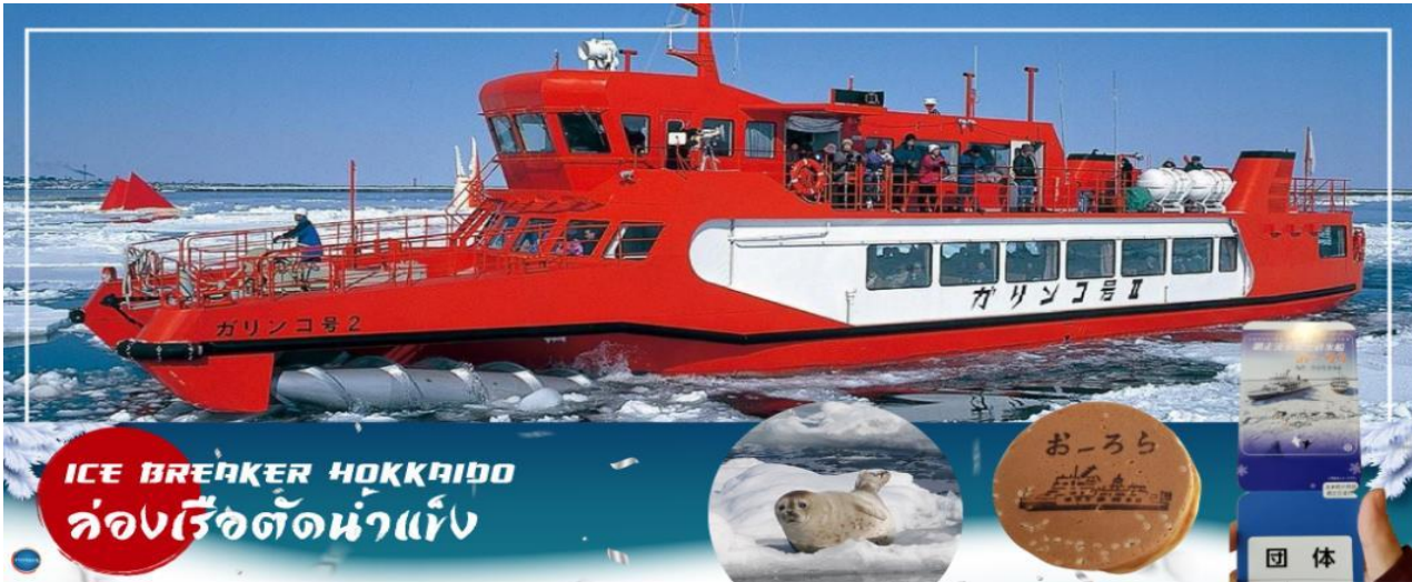
ICE BREAKER HOKKAIDO ล่องเรือตัดน้ำแข็ง

เมืองอาซาฮิคาว่า – เมืองมอนเบ็ทสึ – ล่องเรือตัดน้ำแข็ง – อีออน อาซาฮิคาว่า