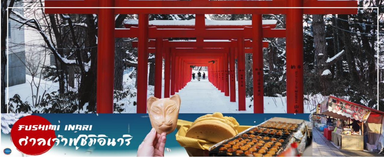
FUSHIMI INARI ศาลเจ้าฟูชิมิอินาริ