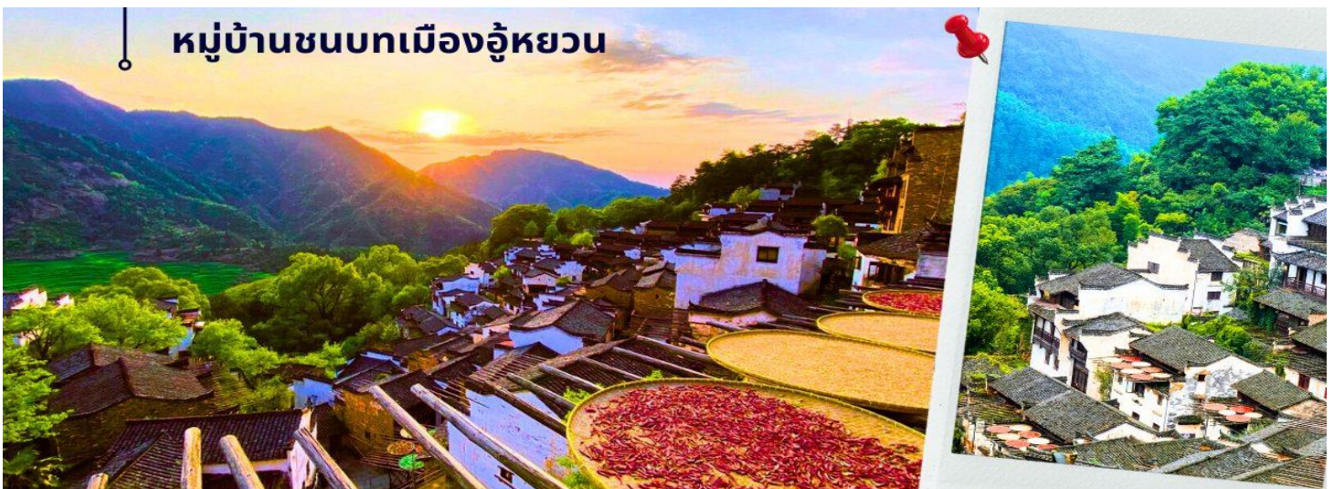
หมู่บ้านชนบทเมืองอู่หยวน

เที่ยง 10 รับประทานอาหารกลางวัน ณ ภัตตาคาร (3) นำท่านเดินทางสู่ หมู่บ้านชนบทเมืองอู่หยวน ใช้เวลาเดินทางประมาณ 1.30 ชั่วโมง “เมืองชนบท ที่งดงามที่สุดของประเทศจีน” เป็นเมืองที่ธรรมชาติกลมกลืนกับวิถีชาวบ้านที่เป็นอยู่อย่างเรียบง่ายได้อย่างลงตัว บ้านเก่าแก่ที่อนุรักษ์ไว้อย่างดี สีสันความงามจากธรรมชาติหมุนเวียนไปตามฤดูกาล ทำให้นักท่องเที่ยวได้สัมผัสบรรยากาศที่แตกต่างกันออกไป ตามแต่ฤดูที่มาเยือนเมืองอู่หยวนแห่งนี้ ซึ่งชาวบ้านยังคงใช้ชีวิตอย่างเรียบง่าย ใช้ชีวิตสบายๆ ริมสายน้ำ ในพื้นที่สีเขียวที่โอบล้อมด้วยภูเขา ด้วยความห่างไกลเมือง และข้อจำกัดเรื่องการเดินทางเข้าถึงในสมัยก่อน ช่วยปกป้องให้อู่หยวนยังคงรักษาธรรมชาติและวิถีชีวิตแบบดั้งเดิมไว้ได้ แม้ว่าปัจจุบันการเดินทางมาที่อู่หยวนจะสะดวกสบายขึ้นมาก และการพัฒนายังเข้าถึงทุกหมู่บ้าน แต่โชคดียังคงมีผู้คนได้เรียนรู้แล้วว่า พวกเขาโหยหาและยังต้องการให้มีหมู่บ้านที่มีบรรยากาศแบบนี้อยู่ต่อไป ดังนั้น อู่หยวนจึงยังคงความบริสุทธิ์อยู่ได้ ภายใต้กระแสการพัฒนาสมัยใหม่ของจีน