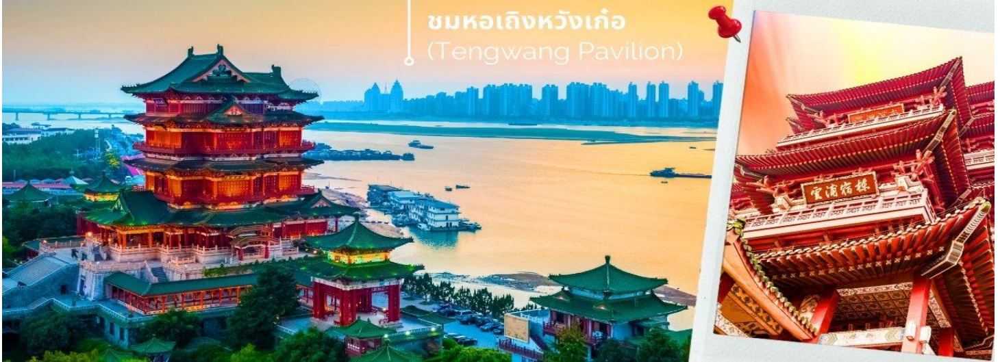
ชมหอเกิ่งหวังเก้อ (Tengwang Pavilion)

ด้วยบทกวีและภาพฝาผนังสมัยราชวงศ์ถังและอื่นๆ 1 ใน 3 หอที่มีชื่อเสียงที่สุดในเมืองจินหนงสูง 9 ชั้น ริมฝั่งแม่น้ำกั้นเจียง ทางตะวันตกเฉียงเหนือของนครหนานชาง