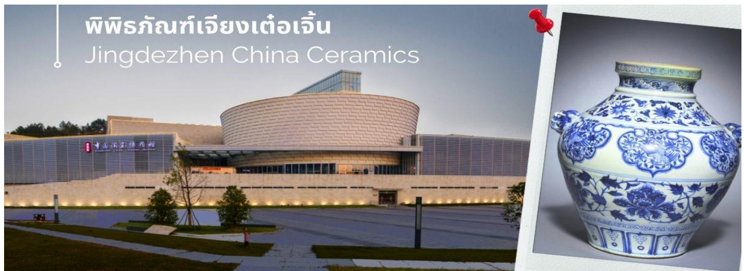
พิพิธภัณฑ์เจียงเต๋อเจิ้น Jingdezhen China Ceramics

นำท่านชม พิพิธภัณฑ์ Jingdezhen China Ceramics เดิมชื่อ Jingdezhen Ceramics Museum เป็นพิพิธภัณฑ์ศิลปะเซรามิกขนาดใหญ่แห่งแรกในจีน เนื้อหาในทรรศการในพิพิธภัณฑ์แบ่งออกเป็น “แผนกประวัติศาสตร์” “แผนกจีนใหม่” และห้องนิทรรศการพิเศษ เป็นที่รวบรวมผลงานเซรามิกที่มีชื่อเสียงจากยุคประวัติศาสตร์ที่แตกต่างกันมากกว่า 20,000 ชิ้น ตั้งแต่ยุคหินใหม่ ราชวงศ์ฮั่นและถัง รวมถึงโบราณวัตถุทางวัฒนธรรมอันล้ำค่าของชาติมากกว่า 500 ชิ้น ครอบคลุมประวัติศาสตร์พันปี