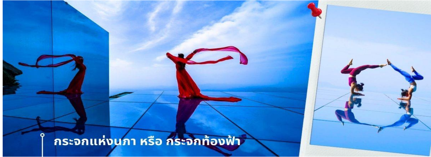
กะจกแห่งนภา หรือ กะจกท้องฟ้า

จากนั้นพาท่านถ่ายภาพความสวยงามของหุบเขาหลิงซาน ในจุดชมวิวกะจกท้องฟ้าและถ่ายภาพที่ได้รับความนิยมจากนักท่องเที่ยวจำนวนมาก นั่นคือ กะจกแห่งนภา หรือ กะจกท้องฟ้า เป็นจุดที่ท่านจะได้ เก็บภาพประทับใจของหุบเขาหลิงซานในมุมที่แปลกตา และน่าตื่นเต้น ด้วยมีลักษณะที่เป็นกะจกเงาสะท้อนตัดกับเส้นขอบฟ้า และภูเขา ถึงทำให้เกิดภาพที่น่านมหัศจรรย์