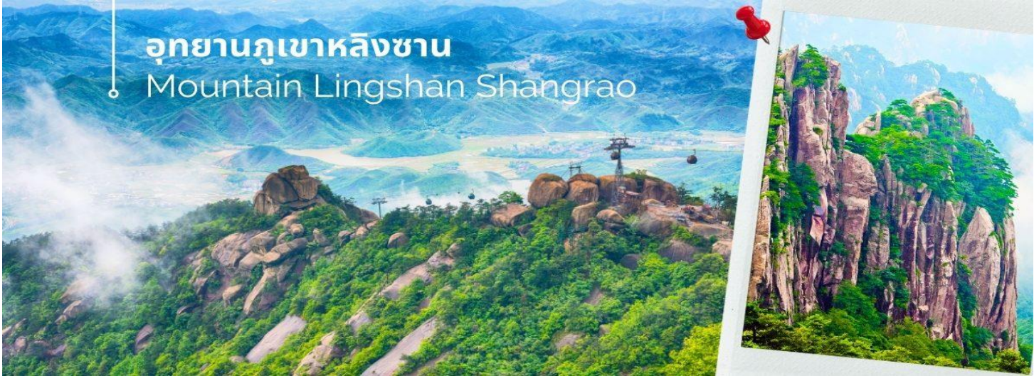
อุทยานภูเขาหลิงซาน Mountain Lingshan Shangrao

เช้า ๑๐ รับประทานอาหารเช้า ณ ห้องอาหารของโรงแรมที่พัก (8) นำท่านเดินทางสู่ อุทยานภูเขาหลิงซาน ตั้งอยู่ทางตอนเหนือของประเทศจีน มณฑลช่างเหรา มีพื้นที่สวยงาม 160 ตารางกิโลเมตร หลิงซานถูกระบุว่าเป็น "หนึ่งใน 33 สถานที่ศักดิ์สิทธิ์ของโลก" โดยหนังสือลัทธิเต๋า เมื่ออากาศแจ่มใสและทัศนวิสัยดี คุณจะเห็นรูปลักษณะที่สวยงามและตั้งตรงของภูเขาหลิงซาน มีความเก่าแก่และมีมนต์ขลังมาก ไม่เพียงแต่มีภูมิทัศน์ที่สวยงาม แต่ยังมีตำนานที่ยาวนานอีกมากมาย เป็นส่วนหนึ่งของภูเขา Huaiyu ภูเขาหินสูงชัน และคดเคี้ยวไปทางทิศตะวันตกจนกระทั่งถึงภูเขาไปหยุนเฟิง และแบ่งออกเป็นสองส่วน ส่วนหนึ่งไปทางเหนือและอีกส่วนหนึ่งไปทางทิศตะวันตก เหมือนพระจันทร์เสี้ยวที่ฝังอยู่ในดินแดนทางตะวันออกเฉียงเหนือของมณฑลเจียงซี