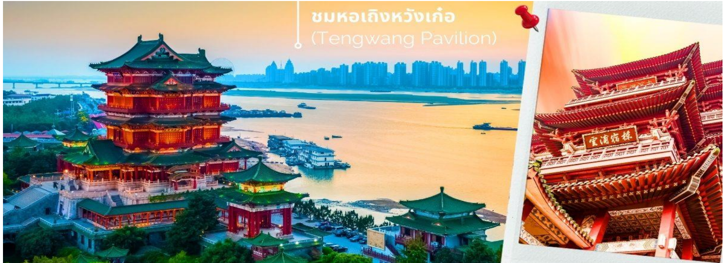
ชมหอเกิงหวังเก้อ (Tengwang Pavilion)

มาในปี 1995 เทศบาลหนานชางจึงทำการสร้างใหม่เป็นตึกคอนกรีตโดยที่ ตึกนี้มีด้วยกัน 9 ชั้น ภายในตกแต่งด้วย บทกวีและภาพฝาผนังสมัยราชวงศ์ถังและอื่นๆ 1 ใน 3 หอที่มีชื่อเสียงที่สุดในเมืองฉิงหนงสูง 9 ชั้น ริมฝั่งแม่น้ำกัน