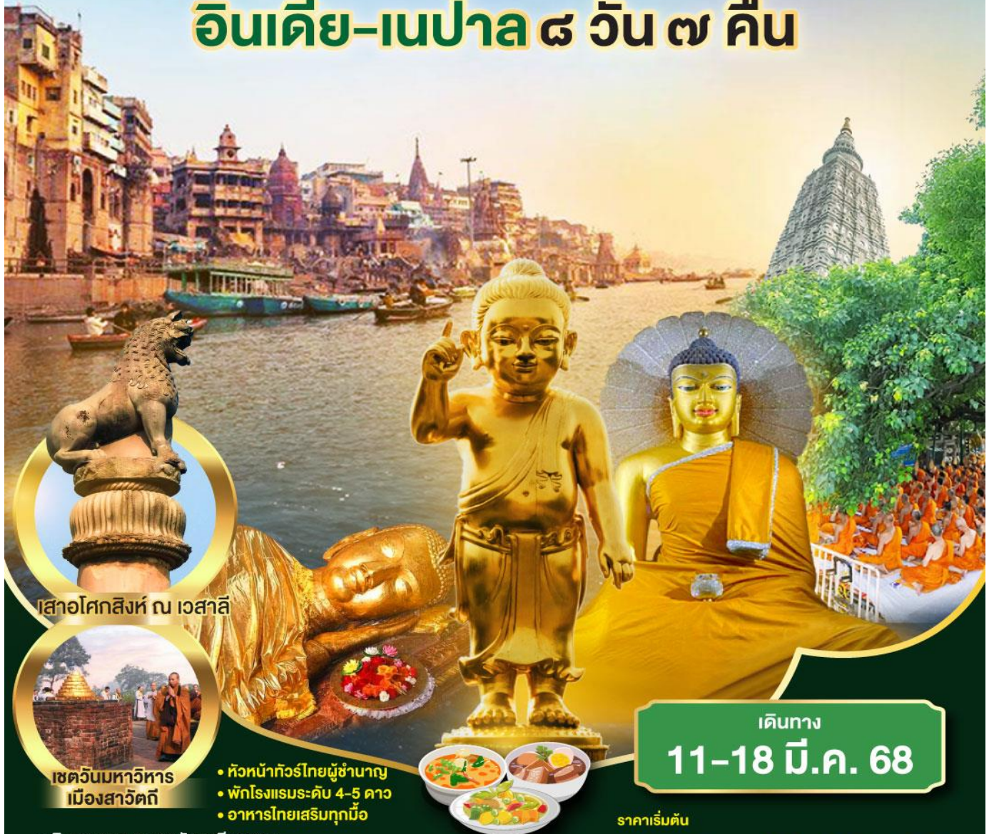
เสาอโศกสิงห์ ณ เวสาลี