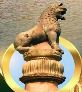
เสาอโศกสิงห์ ณ เวสาลี