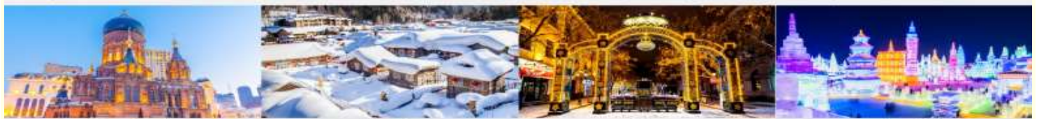
โบสถ์เซนต์โซเฟีย