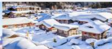
หมู่บ้านหิมะ