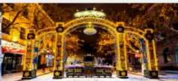
ถนนคนเดินจงหยาง