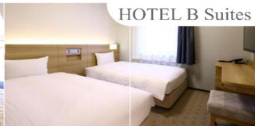
HOTEL B Suites