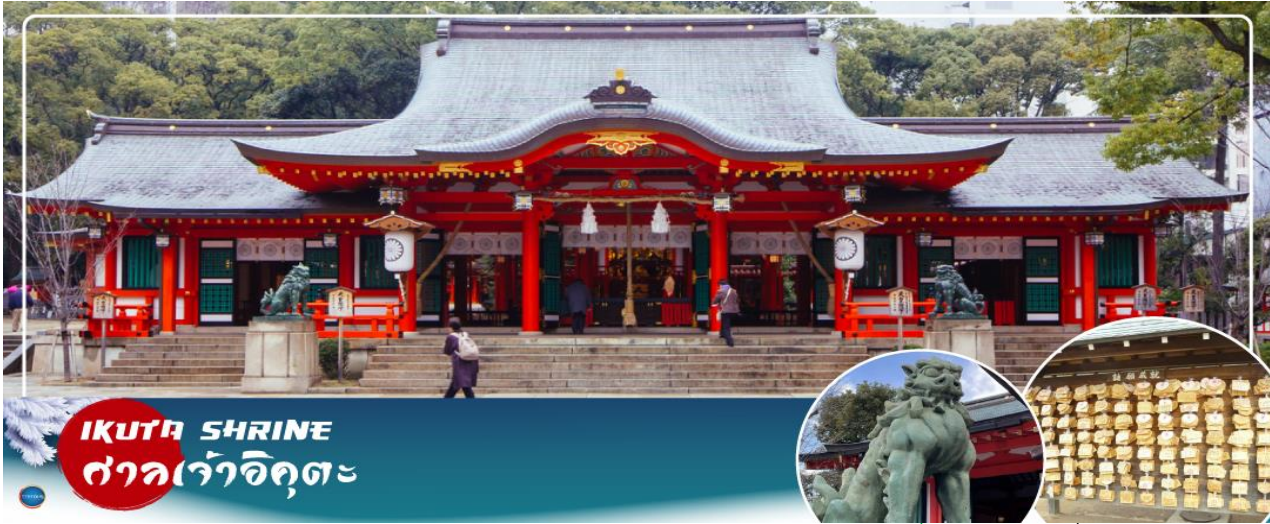
IKUTA SHRINE ศาลเจ้าอิคุตะ

จากนั้นนำท่านสักการะ ศาลเจ้าอิคุตะ (Ikuta Shrine) ตั้งอยู่ในย่านใจกลางเมืองซันโนะมียะ (Sannomiya) เป็นศาลเจ้าที่มีประวัติศาสตร์ยาวนาน ก่อตั้งในปี 201 หนึ่งในสามศาลเจ้าหลักของ โกเบที่มีประวัติศาสตร์ยาวนานกว่า 1,800 ปี ทางเหนือไปตามถนนซ็อนนอิคุตะ คุณจะเห็นทางเข้า ศาลเจ้าพร้อมประตูโทริอิที่สร้างโดยใช้วัสดุรีไซเคิลจากศาลเจ้าใหญ่อิเสะ ศาลเจ้าอิคุตะมีชื่อเสียงใน ด้านผลประโยชน์ในการจับคู่ เนื่องจากจิตอาสนะชนเป็นเทพเจ้าผู้ทอเสื้อผ้าของเทพเจ้า และเธอ ทอด้ายและด้ายเข้าด้วยกัน คนในพื้นที่เรียกกันอย่างเสนหาวว่า "อิคุตะซัง"