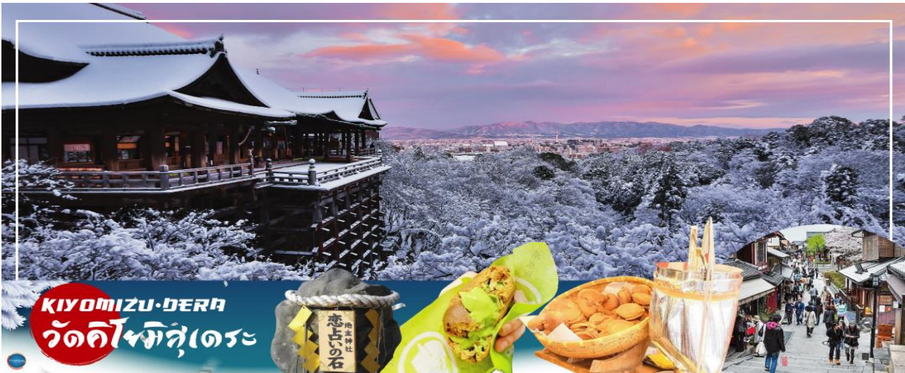
KIYOMIZU-DERA วัดคิโยมิตสึเดระ