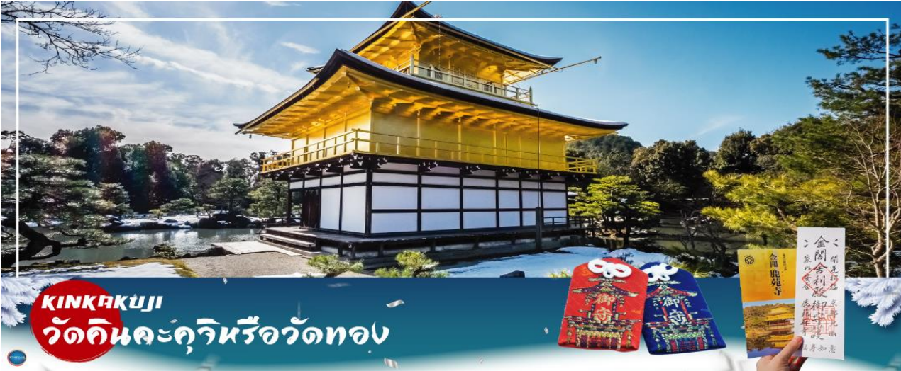
KINKAKUJI วัดคินคะคุจิหรือวัดทอง

วันที่สาม เมืองโอซาก้า – เมืองเกียวโต – วัดคินคะคุจิ – การเรียนพิธีชงชาญี่ปุ่น - วัดคิโยมิตสึเดระ – ย่านชิคาชิยามา – เมืองโอซาก้า – ศาลเจ้านัมมะยาซากะ – ช้อปปิ้งชินไซบาชิ