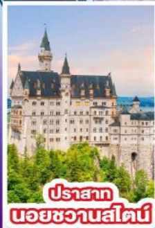
ปราสาท นอยชวานสไตน์