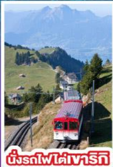
นั่งรถไฟใต้เขาริกิ