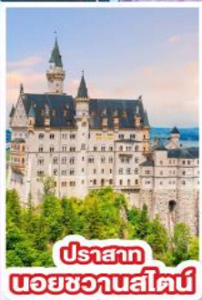
ปราสาท นอยชวานสไตน์