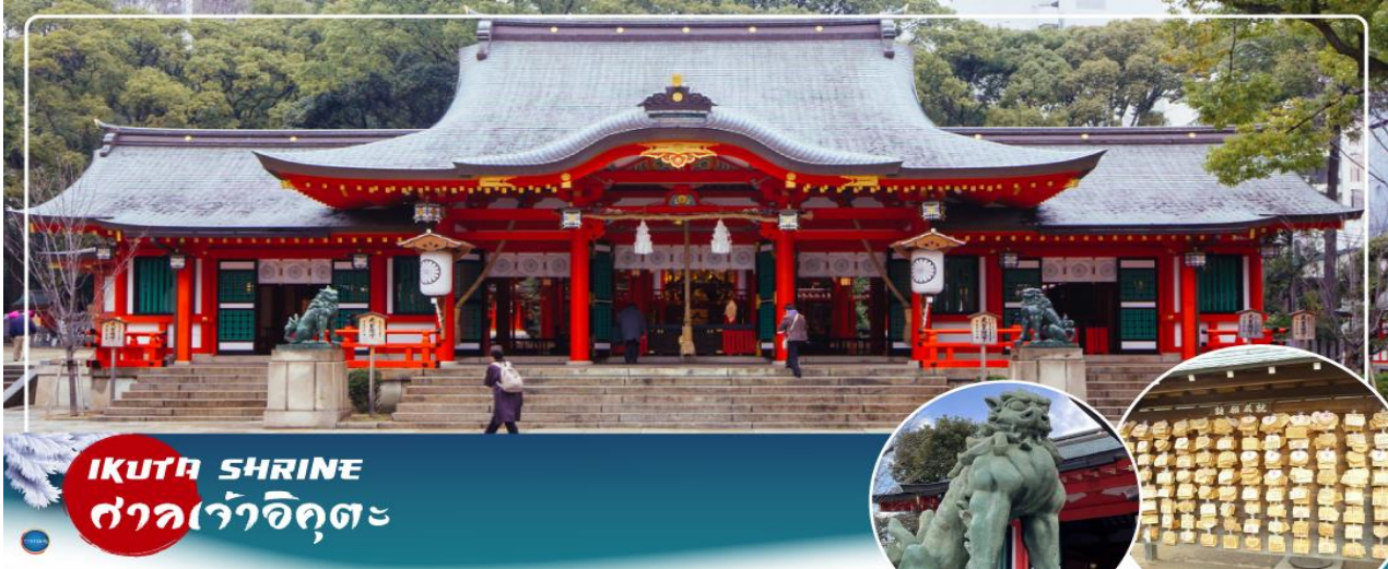
IKUTA SHRINE ศาลเจ้าอิคุตะ

จากนั้นนำท่านสักการะ ศาลเจ้าอิคุตะ (Ikuta Shrine) ตั้งอยู่ในย่านใจกลางเมืองซันโนะมียะ (Sannomiya) เป็นศาลเจ้าที่มีประวัติศาสตร์ยาวนาน ก่อตั้งในปี 201 หนึ่งในสามศาลเจ้าหลักของ โกเบที่มีประวัติศาสตร์ยาวนานกว่า 1,800 ปี ทางเหนือไปตามถนนซ็องถนนอิคุตะ คุณจะเห็นทางเข้า ศาลเจ้าพร้อมประตูโทริอิที่สร้างโดยใช้วัสดุรีไซเคิลจากศาลเจ้าใหญ่อิเสะ ศาลเจ้าอิคุตะมีชื่อเสียงใน ด้านผลประโยชน์ในการจับคู่ เนื่องจากจิตอาสนะชนเป็นเทพเจ้าผู้ทอเสื้อผ้าของเทพเจ้า และเธอ ทอด้ายและด้ายเข้าด้วยกัน คนในพื้นที่เรียกกันอย่างเสนาหว่า "อิคุตะซัง"