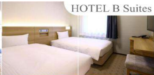
HOTEL B Suites