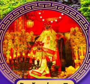
วัดเจ้าแม่กวนอิม ฮ่องง่า