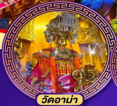
วัดอาเมา