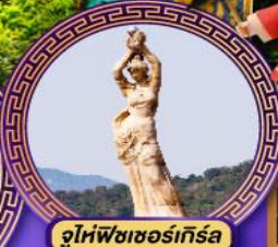
จูไห่พีชชอร์เกิร์ล