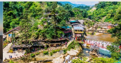
หมู่บ้าน Cat Cat

*ทางบริษัทฯ ขอสงวนสิทธิ์ในการสลับโปรแกรมทัวร์ตามความเหมาะสมขึ้นอยู่กับสถานการณ์ทำงาน โดยคำนึงถึงผลประโยชน์ของลูกค้าเป็นสำคัญ