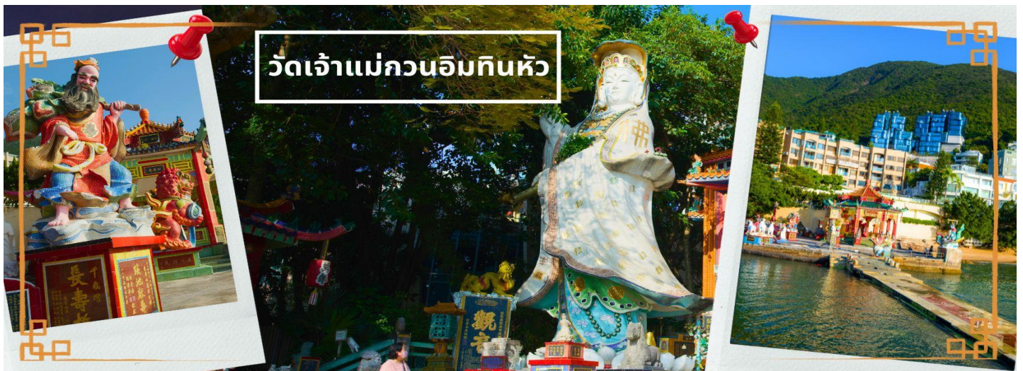
วัดเจ้าแม่กวนอิมทันทิว

นำท่านเดินทางสู่ วัดเจ้าแม่กวนอิมทันทิว อ่าวรีพัลส์เบย์ (TIN HAU TEMPLE REPULSE BAY) ตั้งอยู่ริมทะเล เป็นสถานที่ท่องเที่ยวที่สำคัญ สร้างขึ้นในปี ค.ศ.1993 วัดแห่งนี้ถูกสร้างขึ้นเพื่อคุ้มครองชาวประมงใน การออกเรือไปหาปลา ซึ่งเป็นหนึ่งในวัดที่เก่าแก่ที่สุดของช่องกง บริเวณวัดจะมี เจ้าแม่กวนอิมองค์ใหญ่ ปางประทานพรตั้งอยู่ เป็นเทพที่ชาวช่องกงและคนจีนให้ความเคารพนับถือมากที่สุด สามารถขอพรได้ทุกอย่าง วัดนี้เป็นที่นิยมมีนักท่องเที่ยวเดินทางมาขอพรกันมากมาย เพราะเชื่อในความศักดิ์สิทธิ์ และยังมี เจ้าแม่ทับทิม หรือเทพธิดาแห่งท้องทะเลองค์ใหญ่ ซึ่งคนช่องกง คนมาเก๊า และคนจีน ที่อยู่ริมทะเล ชาวประมง นักเดินเรือหรือผู้ที่เดินทางทางเรือเป็นประจำ จะนับถือเจ้าแม่ทับทิมเป็นอย่างมาก มีความเชื่อว่าเจ้าแม่ทับทิมจะปกป้องเราจากภัยอันตรายระหว่างการเดินทาง ภายในวัดยังมีเทพเจ้าและพระพุทธรูปต่างๆ ประดิษฐานไว้มากมายตามความเชื่อถือศรัทธา เช่น เทพเจ้าไฉ่ซิงเอี้ย ไหว้ขอโชคลาภความมั่งคั่ง ความร่ำรวย, พระสังกัจจายน์โพธิสัตว์ เทพประทาน บุตร-ธิดา ไหว้อธิษฐานขอลูก, สะพานต่ออายุ (สะพานอายุยืน) สะพานสีแดงตั้งอยู่บนริมหาด สีแดงสด เชื่อกันว่า คนจีนเชื่อกันว่าหากเดินข้ามสะพานนี้ เราจะมีอายุยืนขึ้นอีก 3 วัน (3 วัน บนสวรรค์ = 3 ปี บนโลกมนุษย์) นั่นหมายความว่า ถ้าเราเดินข้ามสะพานนี้แล้ว จะมีอายุยืนยาวขึ้นอีก 3 ปี บนโลกมนุษย์, เทพเจ้าแห่งความรัก ไหว้ขอเนื้อคู่, ศาลา 8 เหลี่ยม เชื่อกันว่าเป็นจุดที่มีดวงจуйดีที่สุดในศาลาแปดเหลี่ยม จุดกึ่งกลางของพื้นจะมีรูปแปดเหลี่ยม ให้เราไปยื่นขอพรจากตำแหน่งนี้เพื่อขอพลังจากสวรรค์ และ อีกมากมายให้ท่านได้สักการะบูชา