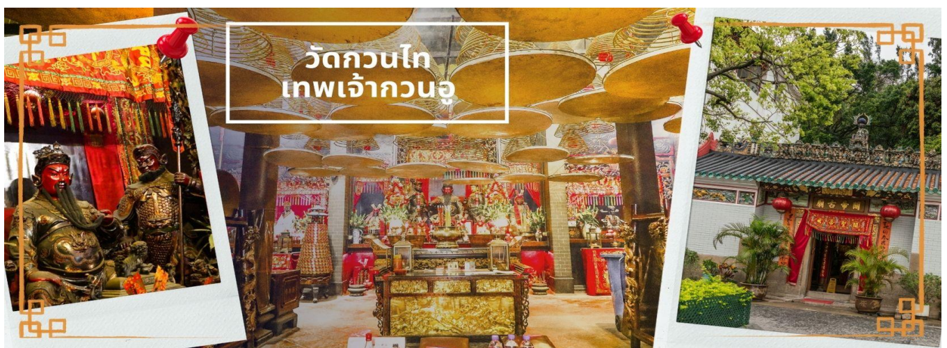
วัดกวนไท เทพเจ้ากวนอู

จากนั้นนำท่านเดินทางสู่ วัดกวนไท เป็นสถานศักดิ์สิทธิ์อันเลื่องชื่อ ถือว่าเป็นวัดแห่งเดียวในเขตเกาลูน ที่สร้างขึ้นเพื่อบูชา เทพเจ้ากวนอู ซึ่งท่านเป็นเทพเจ้าแห่งความซื่อสัตย์ เปี่ยมไปด้วยคุณธรรม โดยศาลเจ้าพ่อกวนอูแห่งนี้ ผู้ที่มาไหว้สักการะจะนิยมขอพรเรื่อง