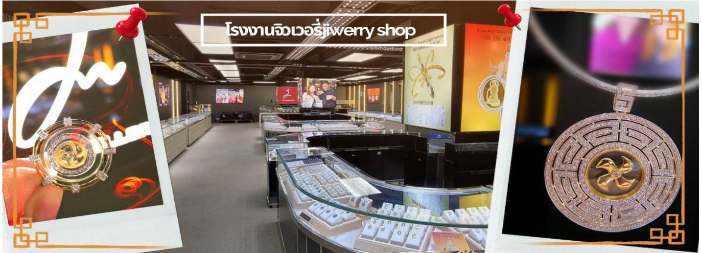
โรงงานจิวเวอรี่ jewelry shop

จากนั้นนำท่านชม โรงงานจิวเวอรี่ ซึ่งเป็นโรงงานที่มีชื่อเสียงที่สุดของชื่องงในเรื่องการออกแบบเครื่องประดับ อาทิเช่น จี้ และแหวนกั้งหัน ที่สวยงามโดดเด่นไม่เหมือนใคร ซึ่งถือกำเนิดขึ้นที่นี่และมีชื่อเสียงที่สุดใช้เป็นเครื่องประดับติดตัว และเสริมดวงชะตาสินค้าทุกชิ้นมีเอกสารรับประกันคุณภาพเปลี่ยน ซ่อม ได้ตลอดอายุการใช้งาน หากเกิดการชำรุดจากสินค้าไม่ใช่อุบัติเหตุ และนำท่านเลือกซื้อ เครื่องประดับที่ ร้านหยก ซึ่งคนจีนนั้นถือว่าหยกเป็นหิน ที่เป็นตัวแทนของความสวยงามและความบริสุทธิ์ มีความเชื่อว่าหยกมงคล ถ้าพกติดตัวไว้จะอายุยืนและสุขภาพดี