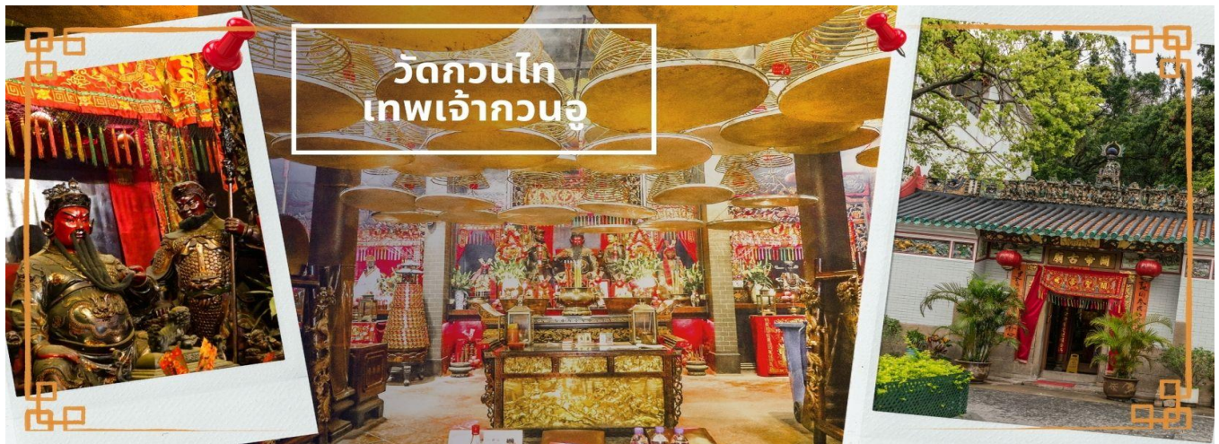
วัดกวนไท เทพเจ้ากวนอู

จากนั้นนำท่านเดินทางสู่ วัดกวนไท เป็นสถานศักดิ์สิทธิ์อันเลื่องชื่อ ถือว่าเป็นวัดแห่งเดียวในเขตเกาลูน ที่สร้างขึ้นเพื่อบูชา เทพเจ้ากวนอู ซึ่งท่านเป็นเทพเจ้าแห่งความซื่อสัตย์ เปี่ยมไปด้วยคุณธรรม โดยศาลเจ้าพ่อกวนอูแห่งนี้ ผู้ที่มาไหว้สักการะจะนิยมขอพรเรื่อง