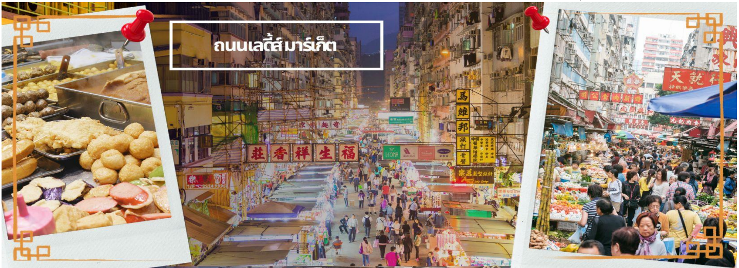
ถนนเลดี้ส์มาร์เก็ต

จากนั้นนำท่านเดินทางสู่ ย่านมงก๊ก เป็นย่านที่มีความคึกคักที่สุดแห่งหนึ่งในเกาะฮ่องกงก็ว่าได้ เป็นสวรรค์ของนักช้อปปิ้งหนึ่งที่สายช้อปปิ้งจะพลาดไม่ได้ นับได้ว่าเป็นย่านช้อปปิ้งที่คึกคักมากอีกแห่งหนึ่งของฮ่องกงเพราะเป็นย่านช้อปปิ้งที่มีทั้งร้านค้า และคนที่มาช้อปปิ้งจากที่ต่างๆ มากมายไม่ขาดสายตั้งแต่กลางวันยันกลางคืน เป็นถนนช้อปปิ้งที่มีสีสันมาก ถ้าเทียบกับญี่ปุ่นแล้วก็เปรียบเหมือนการเดินทางที่ชิบูย่าเลยก็ว่าได้ และยังมี ถนนเลดี้ส์ มาร์เก็ต (LADIES MARKET) ที่มีทั้งเครื่องสำอาง เสื้อผ้า รองเท้า กระเป๋า เครื่องประดับมากมายให้เลือกช้อป อีกทั้งยังมีร้านอาหารและเครื่องดื่ม ที่ขึ้นชื่อหลากหลายชนิด ให้ทุกท่านได้ลองลิ้มรสอีกมากมาย