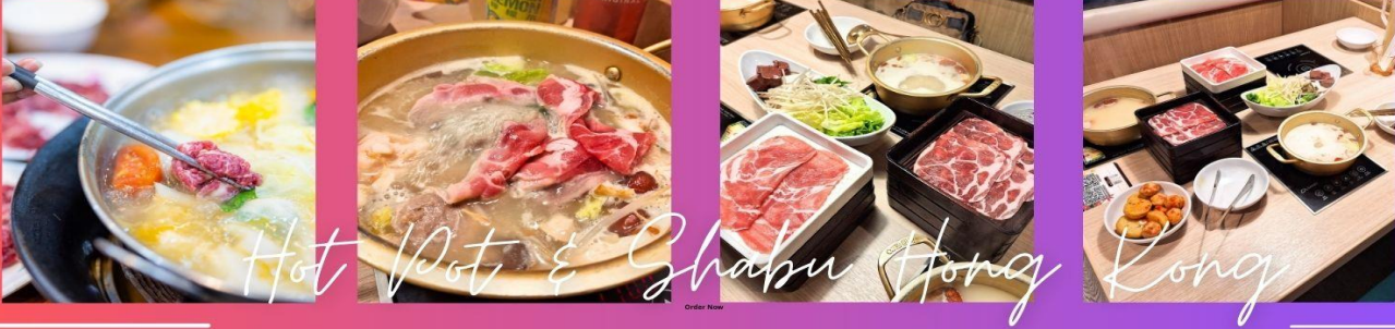
พิเศษเมนูชาบู สไตส์ฮ่องกง

จากนั้นนำท่านเดินทางสู่ ย่านมงก๊ก เป็นย่านที่มีความคึกคักที่สุดแห่งหนึ่งในเกาะฮ่องกงก็ว่าได้ เป็นสวรรค์ของนักช้อปปิ้งหนึ่งที่สายช้อปปิ้งจะพลาดไม่ได้ นับได้ว่าเป็นย่านช้อปปิ้งที่คึกคักมากอีกแห่งหนึ่งของฮ่องกงเพราะเป็นย่านช้อปปิ้งที่มีทั้งร้านค้า และคนที่มาช้อปปิ้งจากที่ต่างๆ มากมายไม่ขาดสายตั้งแต่กลางวันยันกลางคืน เป็นถนนช้อปปิ้งที่มีสีสันมาก ถ้าเทียบกับญี่ปุ่นแล้วก็เปรียบเหมือนการเดินทางที่ชิบูย่าเลยก็ว่าได้ และยังมี ถนนเลดี้ส์ มาร์เก็ต (LADIES MARKET) ที่มีทั้งเครื่องสำอาง เสื้อผ้า รองเท้า กระเป๋า เครื่องประดับมากมายให้เลือกช้อป อีกทั้งยังมีร้านอาหารและเครื่องดื่ม ที่ขึ้นชื่อหลากหลายชนิด ให้ทุกท่านได้ลองลิ้มรสอีกมากมาย