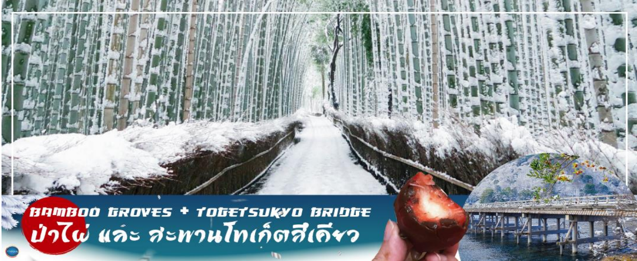
BAMBOO GROVES + TOGETSUKYO BRIDGE ป่าไผ่ และ สะพานโทเก็ตสึเคียว

01.15 น. เห็นฟ้าสู่ เมืองโอซาก้า ประเทศญี่ปุ่น โดยเที่ยวบินที่ XJ612 สายการบิน AIR ASIA X ใช้เครื่อง AIRBUS A330-300 จำนวน 377 ที่นั่ง จัดที่นั่งแบบ 3-3-3 (น้ำหนักกระเป๋า 20 กก./ท่าน หากต้องการซื้อน้ำหนักเพิ่ม ต้องเสียค่าใช้จ่าย)