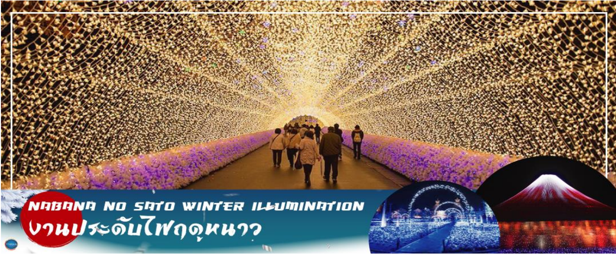
NABANA NO SATO WINTER ILLUMINATION งานประดับไฟฤดูหนาว

ชม งานประดับไฟฤดูหนาว ณ หมู่บ้านนาบานะ โนะ ซาโตะ (Nabana no Sato Winter Illumination) เป็นธีมพาร์คสวนดอกไม้ ที่มีทุ่งดอกไม้ให้ชมตลอดทั้ง 4 ฤดูกาล สามารถเที่ยวได้ตลอดทั้งปี ไฮไลท์!!! การประดับไฟขนาดใหญ่ที่สุดในญี่ปุ่น จะมีในช่วงฤดูใบไม้ร่วงตลอดจนถึงปลายฤดูหนาว (ตุลาคม-มีนาคม) จะได้รับความนิยมมากเป็นพิเศษ เนื่องจากมี การแสดงไฟในหลากหลายรูปแบบ ไม่ว่าจะเป็น อุโมงค์แสงไฟ (Tunnel of Light) หรือ การประดับไฟในน้ำ (Water Illumination) อีสาระให้ท่านได้เพลิดเพลินกับอลังการงานประดับไฟที่ไม่ว่าจะหันไปทางไหนก็มีมุมให้เก็บภาพประทับใจกลับไปอย่างมากมาย