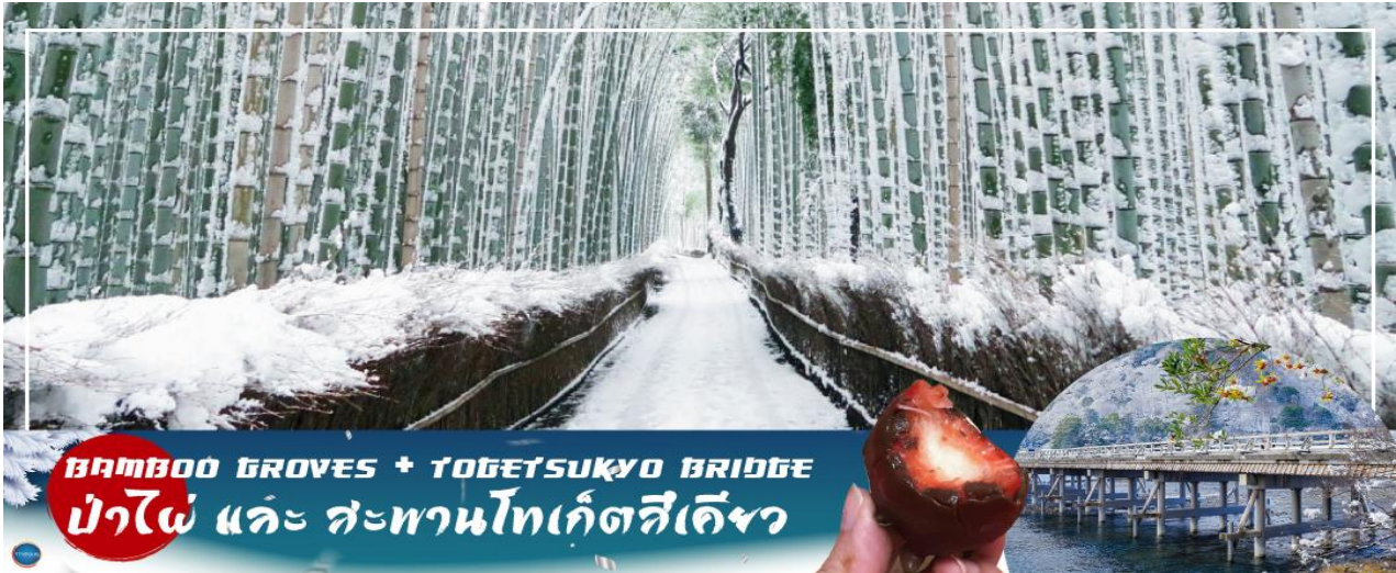
BAMBOO GROVES + TOGETSUKYO BRIDGE ป่าไผ่ และ สะพานโทเก็ตสึเคียว

วันที่สอง ท่าอากาศยานนานาชาติคันไซ โอซาก้า – เมืองเกียวโต – อาราชิยามา – สวนป่าไผ่ – สะพานโทเก็ตสึเคียว – เมืองนาโกย่า – ชมงานประดับไฟฤดูหนาว ณ หมู่บ้านนาบะ โนะซาโตะ