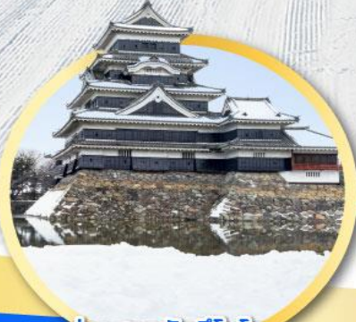
ปราสาทมัตสึไมโตะ