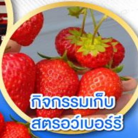
กิจกรรมเก็บ สตอร์วเบอร์รี่

เดินทาง 17-22 ม.ค. 68 31 ม.ค.-05 ก.พ. 68 04-09, 07-12 ก.พ. 68 (วันหยุดวันมาฆบูชา) 14-19, 21-26 ก.พ. 68 04-09, 07-12, 11-16 มี.ค. 68 14-19, 19-24 มี.ค. 68