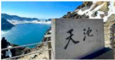
อุทยานฉางโปชาน