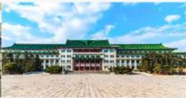
จัตุรัสวัฒนธรรม