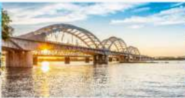
สะพานรถไฟ