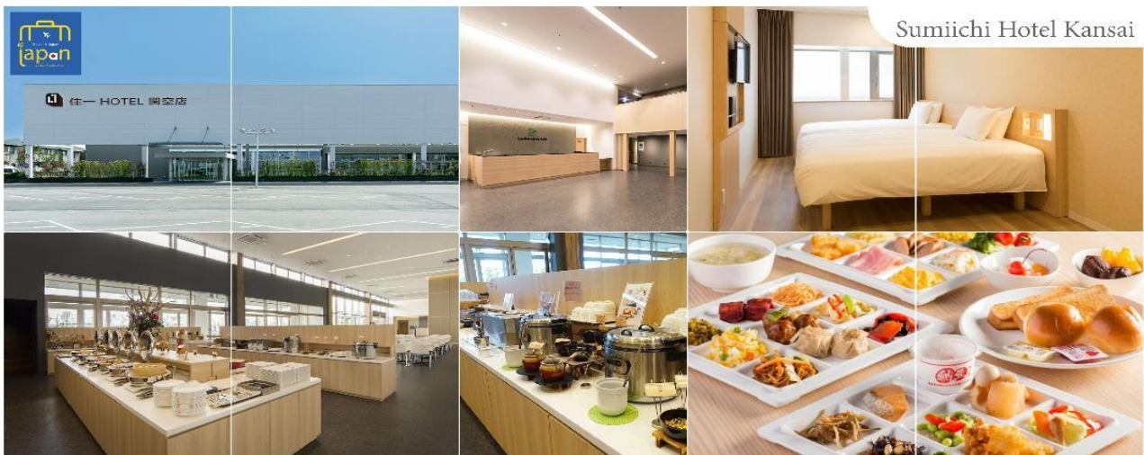
Sumiichi Hotel Kansai

พักที่ SUMIICHI HOTEL KANSAI หรือเทียบเท่าระดับเดียวกัน (โดยรถบัสโรงแรม)