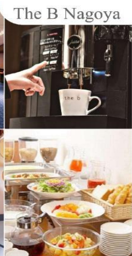
The B Nagoya