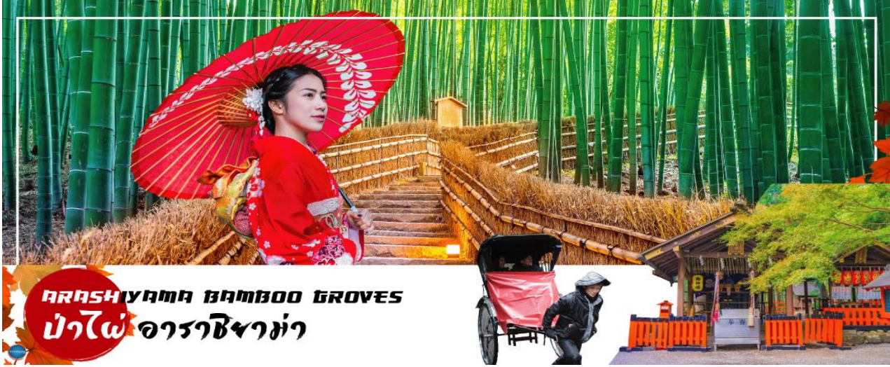
ARASHIYAMA BAMBOO GROVES ป่าไผ่ อาราชิมามา

วันที่สอง ท่าอากาศยานนานาชาติคันไซ โอซาก้า – เมืองเกียวโต – อาราชิมามา – สวนป่าไผ่ – สะพานโทเกดส์เคียว – เมืองนาโกย่า – ชมงานประดับไฟฤดูหนาว ณ หมู่บ้านนาบาระ โนะซาโตะ