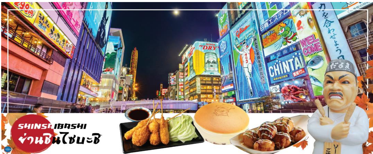
SHINSAIBASHI ย่านชินไซบาชิ

นำทุกท่านเช็คอินจุดถ่ายรูปที่ ศาลเจ้านัมมะยะซากะ (Namba Yasaka Shrine) ตั้งอยู่ในย่านนัมมะของเมืองโอซาก้า ไฮไลท์ของศาลเจ้าแห่งนี้ คือรูปปั้นหน้าสิงโตอ้าปากขนาดใหญ่ ที่เชื่อกันว่า สามารถสั่นกินปีศาจร้าย หรือ สิ่งไม่ดีทั้งหลาย ให้หายไป และนำพามาซึ่งความโชคดีให้แก่ผู้คน ปัจจุบันนักเรียน นักศึกษา และผู้ประกอบการธุรกิจนั้น นิยมมาขอพรให้ประสบความสำเร็จกันที่นี่ ด้วยความสูง 17 เมตร ความกว้าง 11 เมตรและความลึก 7 เมตร อีสระให้ทุกท่านสักการะ และเก็บภาพที่ ศาลเจ้านัมมะ ยะซากะ