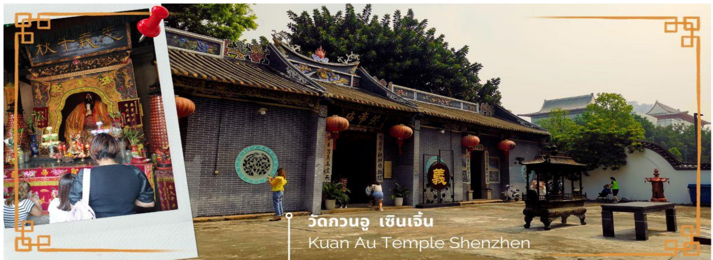
วัดกวนอู เซินเจิ้น Kuan Au Temple Shenzhen

จากนั้นนำท่านเดินทางสู่ วัดกวนอู ไหว้เทพเจ้ากวนอู สัญลักษณ์ของความซื่อสัตย์ ความกตัญญูรู้คุณ ความจงรักภักดี ความกล้าหาญ โศคลาภ และบารมี ท่านเปรียบเสมือนตัวแทนของความเข้มแข็งเด็ดเดี่ยวของอาจไม่ครั้งคร้ามต่อศัตรู ท่านเป็นคนจิตใจมั่นคงตั้งขุนเขา มีสติปัญญาเฉลียวฉลาด และไม่เคยประมาทการบูชาขอพรท่านก็หมายถึงขอให้ท่านช่วยอุดช่องว่างไม่ให้เพเสียงพลาแกฝ่ายตรงข้าม และให้เกิดความสมบูรณ์ด้วยคนข้างเคียงที่ซื่อสัตย์ หรือบริวารที่ไว้วางใจได้นั้นเองดังนั้นประชาชนคนจีนจึงนิยมบูชา และกราบไหว้เพื่อความเป็นสิริมงคลต่อตนเอง และครอบครัวในทุกๆ ด้าน