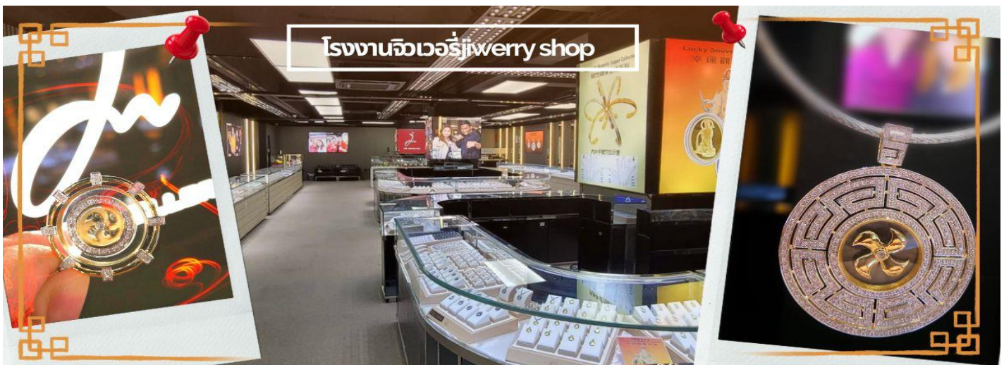
โรงงานจิวเวอรี่ jewelry shop

จากนั้นนำท่านชม โรงงานจิวเวอรี่ ซึ่งเป็นโรงงานที่มีชื่อเสียงที่สุดของฮ่องกงในเรื่องการออกแบบเครื่องประดับ อาทิเช่น จี้ และแหวนกำหั้น ที่สวยงามโดดเด่นไม่เหมือนใคร ซึ่งถือกำเนิดขึ้นที่นี่และมีชื่อเสียงที่สุดใช้เครื่องประดับติดตัว และเสริมดวงชะตา สินค้าทุกชิ้นมีเอกสารรับประกันคุณภาพเปลี่ยน ซ่อม ได้ตลอดอายุการใช้งาน หากเกิดการชำรุดจากสินค้าไม่ใช่อุบัติเหตุ