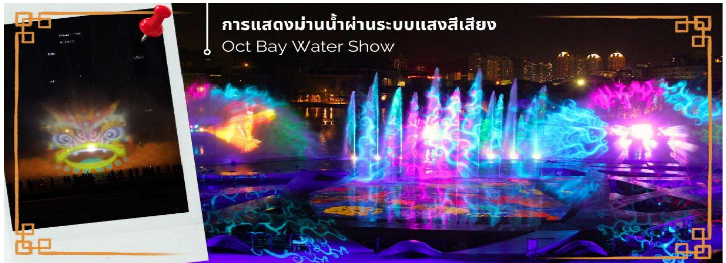
การแสดงม่านน้ำผ่านระบบแสงสีเสียง Oct Bay Water Show

CCXS1 ฮองกง-เซินเจิ้น-ไหว้พระ 3 วัดดัง ชมการแสดงโชว์วิมานน้ำ 3 วัน 2 คืน CX (SEP-MAR25)