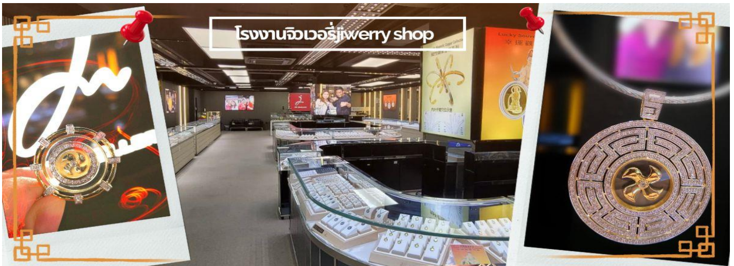
โรงงานจิวเวอรี่jewery shop

จากนั้นนำท่านชม โรงงานจิวเวอรี่ ซึ่งเป็นโรงงานที่มีชื่อเสียงที่สุดของฮ่องกงในเรื่องการออกแบบเครื่องประดับ อาทิเช่น จี้ และแหวนกำหั้น ที่สวยงามโดดเด่นไม่เหมือนใคร ซึ่งถือกำเนิดขึ้นที่นี่และมีชื่อเสียงที่สุดใช้เครื่องประดับติดตัว และเสริมดวงชะตา สินค้าทุกชิ้นมีเอกสารรับประกันคุณภาพเปลี่ยน ซ่อม ได้ตลอดอายุการใช้งาน หากเกิดการชำรุดจากสินค้าไม่ใช่อุบัติเหตุ