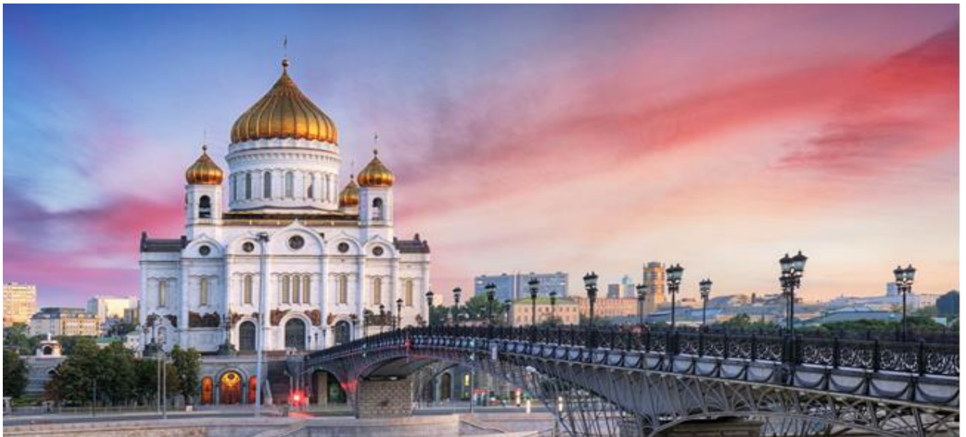
***ภาพประกอบใช้เพื่อการโฆษณาเท่านั้น***

นำท่านชม วิหารเซนต์ เดอซาร์เวียร์ (THE CATHEDRAL OF CHRIST OUR SAVIOUR) สร้างขึ้นเมื่อปี ค.ศ.1839 ในสมัยพระเจ้าซาร์อเล็กซานเดอร์ที่ 1 เพื่อเป็นอนุสรณ์แห่งชัยชนะและแสดง กตัญญูแด่พระเจ้าที่ทรงช่วยปกป้องรัสเซียให้รอดพ้นจากสงครามโปเลียน โดยใช้เวลาก่อสร้าง นานถึง 45 ปี แต่ต่อมาในปี ค.ศ.1990 สตาลินผู้นำพรรคคอมมิวนิสต์ในขณะนั้นได้สั่งให้ทุบโบสถ์ทิ้งเพื่อตัดแปลง เป็นสระว่ายน้ำที่ใหญ่ที่สุดในโลกจนเมื่อปีค.ศ.1994 ประธานาธิบดี บอริส เยลซิน ได้อนุมัติให้มีการก่อสร้างวิหาร ขึ้นมาใหม่ด้วยเงินบริจาคของคนทั้งประเทศ ซึ่งจำลองของเดิมได้เกือบร้อยเปอร์เซ็นต์ วิหารนี้จึงกลับมาเย็นหยัด ที่เดิมอีกครั้งโดยสร้างเสร็จสมบูรณ์และทำพิธีเมื่อวันที่ 19 สิงหาคม ค.ศ.2000 ปัจจุบันวิหารนี้ใช้ในการประกอบ พิธีกรรมสำคัญระดับชาติของรัสเซีย