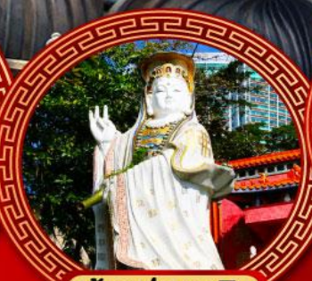
เจ้าแม่กวนอิม รีพลัสเบย์