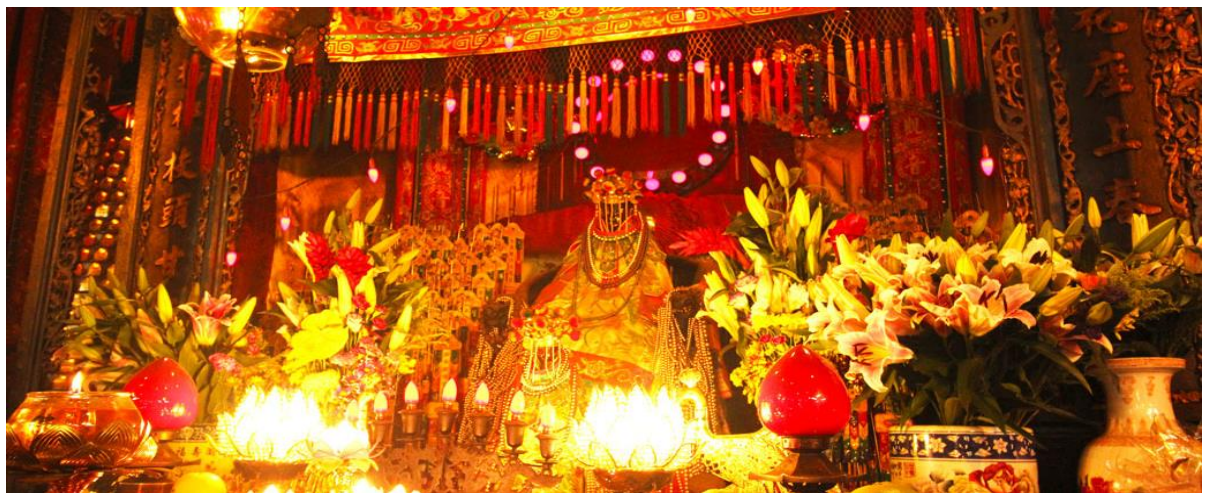
GO1HKG-HX001 ฮ่องกง เสริมสิริมงคล เปิดทองพระคลังเจ้าแม่กวนอิมฮ่องฮ่า 5 วัน 3 คืน (พัก 5 ดาว) โดยสายการบิน Hong Kong Airlines (HX)

วันเปิดทองพระคลัง หรือ วันเปิดทรัพย์ สำหรับปี 2568 จะตรงกับวันที่ 23 กุมภาพันธ์ 2568 (ในแต่ละปีจะไม่ตรงกันเพราะนับจากการคำนวณตามปฏิทินจันทรคติจีน) ซึ่งทางวัดจะมีการจัดทำพิธีขอยืมเงินเจ้าแม่กวนอิม ขอพรด้านเงินทอง ความเจริญมั่งมีมั่งคั่งในชีวิต ให้ท่านได้ร่วมพิธีการศักดิ์สิทธิ์และเก่าแก่ของชาวฮ่องกงที่สืบทอดกันมา โดย 1 ปี จะมีเพียง 1 ครั้ง และในวันนี้จะมีผู้คนหลังไหลกันเข้ามาไหว้ขอพรกันเป็นจำนวนมาก ทั้งชาวฮ่องกงเอง ชาวจีนแผ่นดินใหญ่ รวมถึงนักท่องเที่ยวต่างชาติ ต่างก็มารอคิวข้ามคืนเพื่อต้องการเข้าร่วมทำพิธีกันอย่างมากมาย