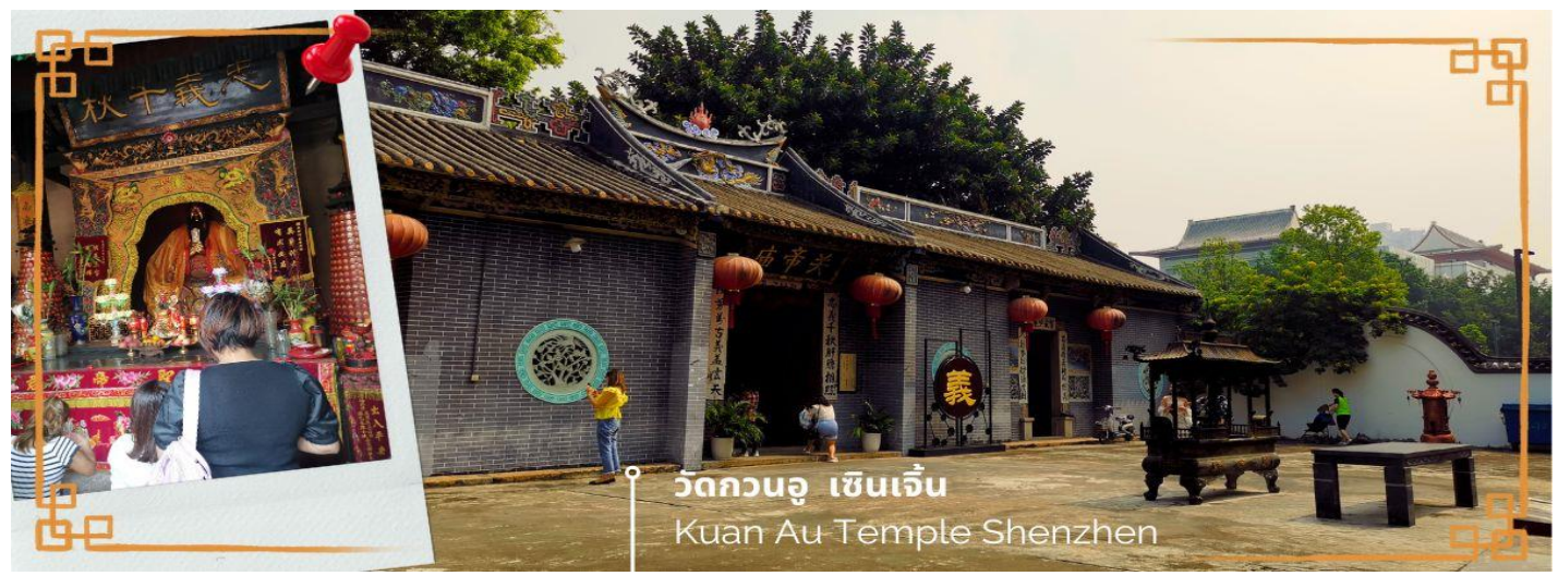
วัดกวนอู เซินเจิ้น Kuan Au Temple Shenzhen

เช้า 🍲 บริการอาหารเช้า ณ ห้องอาหารของโรงแรม (3) จากนั้นนำท่านเดินทางสู่ วัดกวนอู ไหว้เทพเจ้ากวนอู สัญลักษณ์ของความซื่อสัตย์ ความกตัญญูรู้คุณ ความจงรักภักดี ความกล้าหาญ โศคลาภ และบารมี ท่านเปรียบเสมือนตัวแทนของความเข้มแข็งเด็ดเดี่ยวของอาจไม่ครั้งคร้ามต่อศัตรู ท่านเป็นคนจิตใจมุ่งมั่นคงตั้งขุนเขา มีสติปัญญาเฉลียวฉลาด และไม่เคยประมาทการบูชาขอพรท่านก็หมายถึงขอให้ท่านช่วยอุดช่องว่างไม่ให้เพรียงพลั่วแก่ฝ่ายตรงข้าม และให้เกิดความสมบูรณ์ด้วยคนข้างเคียงที่ซื่อสัตย์ หรือบริวารที่ไว้วางใจได้นั้นเองตั้งนั้นประชาชนคนจีนจึงนิยมบูชา และกราบไหว้เพื่อความเป็นสิริมงคลต่อตนเอง และครอบครัวในทุกๆ ด้าน