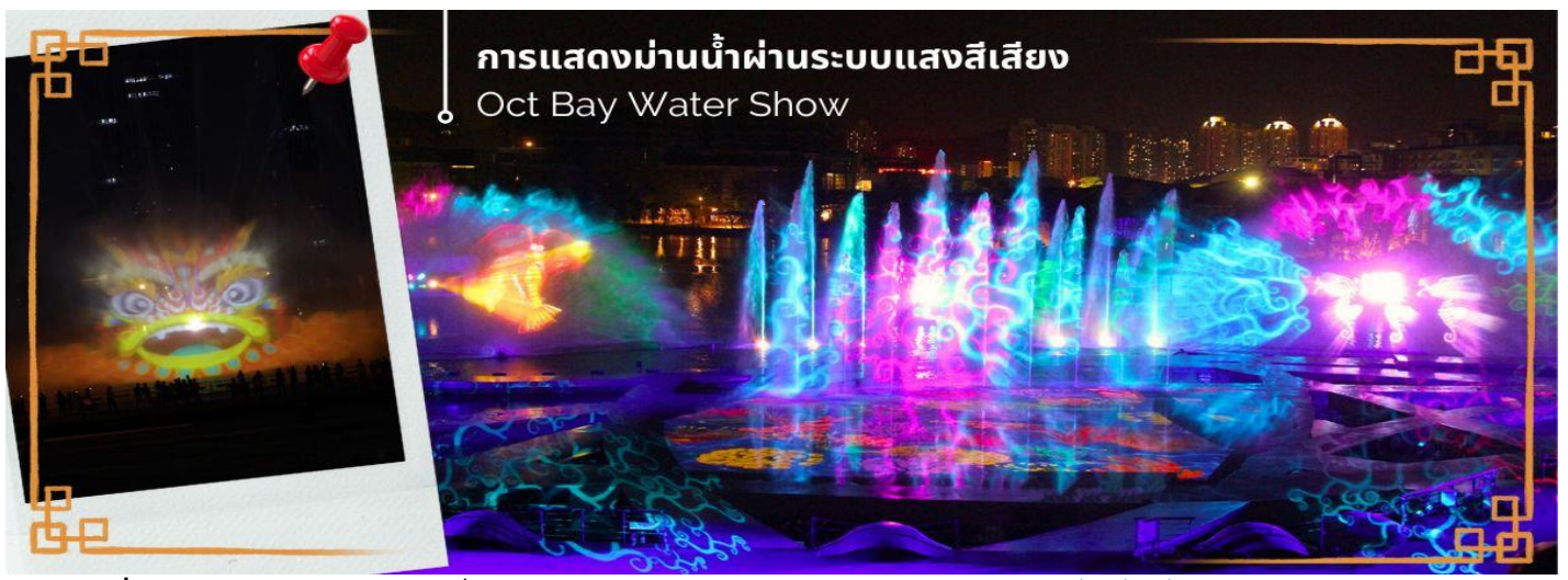
การแสดงม่านน้ำผ่านระบบแสงสีเสียง Oct Bay Water Show

CCXS1 ฮ่องกง-เซินเจิ้น-ไห่ฟู่ 3 วัดดัง ชมการแสดงโชว์วิมานน้ำ 3 วัน 2 คืน CX (SEP-MAR25)