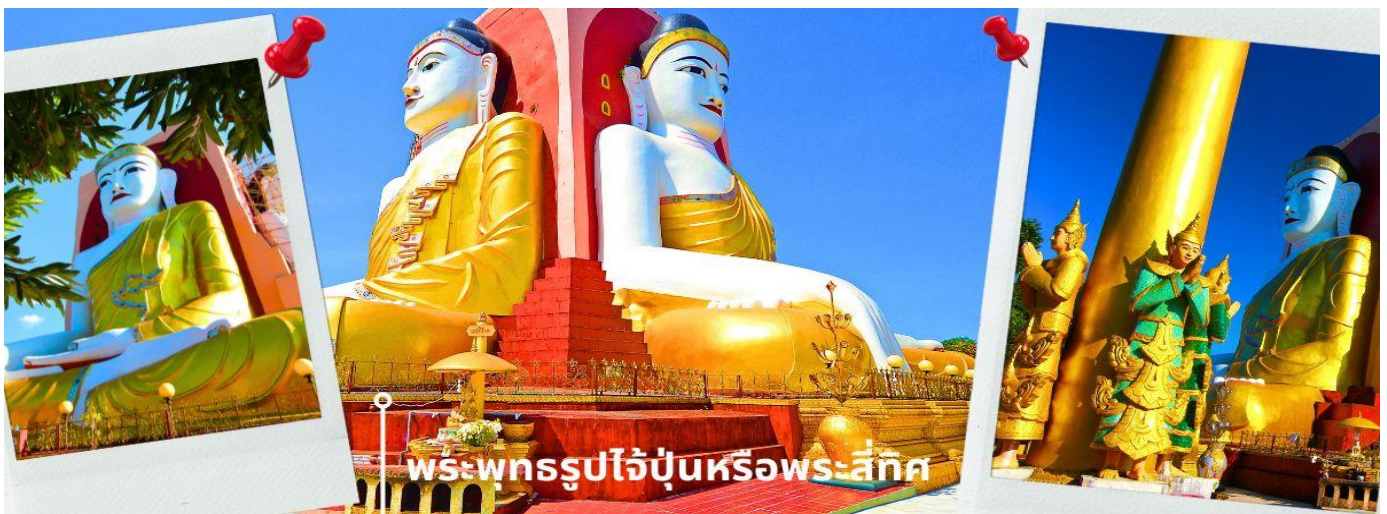
พระพุทธรูปไข่ปูนหรือพระสี่ทิศ

นำท่านเดินทางสู่ เมืองหงสาวดี หรือ เมืองพะโค ซึ่งในอดีตเป็นเมืองหลวงที่เก่าแก่ที่สุด ของเมืองมอญโบราณที่ยิ่งใหญ่และอายุมากกว่า 400 ปี อยู่ห่างจากย่างกุ้ง (ระยะทางประมาณ 80 กิโลเมตร ใช้เวลาเดินทางประมาณ 1.45 ชม.) นำท่านนมัสการ พระพุทธรูปไข่ปูนหรือพระสี่ทิศ เป็นพระเจดีย์ที่มีพระพุทธรูปปางมารวิชัยขนาดใหญ่ทั้ง 4 ด้านอายุกว่า 500 ปี หันพระพักตร์ไปยัง 4 ทิศ สร้างขึ้นโดย 4 สาวพี่น้องที่อุทิศตนแต่พุทธศาสนาจึงสร้างพระพุทธรูปเพื่อแทนตนเอง และได้สาบานไว้ว่าจะไม่ข้องแวะกับบุรุษเพศ ต่อมาน้องสาวคนสุดท้าย กลับพบรักกับชายหนุ่มและแต่งงานกัน จึงเกิดอาเพศฟ้าผ่าพระพุทธรูปที่แทนตัวของน้องสาวคนสุดท้ายพังทลายลงมา และมีการบูรณะขึ้นมาใหม่จึงทำให้พระพุทธรูปองค์นี้จะมีลักษณะ แตกต่างจากองค์อื่นๆ