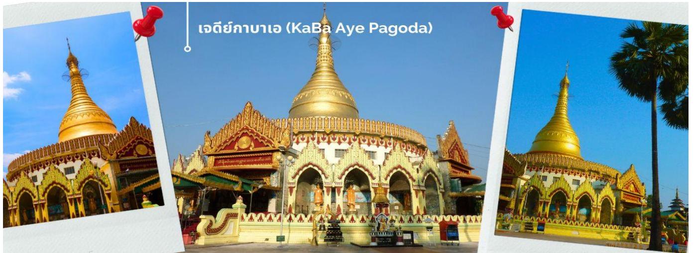
เจดีย์กาบาเอ (KaBa Aye Pagoda)

จากนั้นนำท่าน เดินทางไปยัง เจดีย์กาบาเอ (KaBa Aye Pagoda) เพื่อร่วมพิธี เทินพระธาตุ พิธีอันศักดิ์สิทธิ์ เป็นเจดีย์ทรงกลมครึ่งใบ ซึ่งมีทางเข้าทั้งหมดห้าด้านด้วยกัน นายอุหนายกคนแรกของพม่า ได้สร้างขึ้นเพื่อใช้เป็นสถานที่ชำระพระไตรปิฎก สูง 34 เมตร สร้างขึ้นเมื่อปี 1952 เพื่อทำการสังคายนา พระไตรปิฎกครั้งที่ 6 เป็นเจดีย์ที่มีความสวยงามและแปลกตา ภายในบรรจุพระอัฐิธาตุของพระอัครสาวกแห่งองค์พระสัมมาสัมพุทธเจ้า คือพระโมคคัลลานะและพระสารีบุตร จะมีทางเข้าทั้งหมดห้าด้าน ทุกด้านมีพระพุทธรูปประดิษฐานอยู่บนฐานทักษิณ มีพระพุทธรูปหุ้มด้วยทองคำองค์เล็ก ๆ อีก 28 องค์ แทนอดีตสาวกของพระพุทธเจ้าทั้ง 28 องค์ ที่อุบัติขึ้นในโลกนี้ ส่วนพระพุทธรูปองค์พระประธานที่อยู่ข้างในหล่อด้วยเงินบริสุทธิ์มีน้ำหนัก กว่า 500 กิโลกรัม และ เข้าร่วมพิธีเทินพระธาตุเพื่อความเป็นสิริมงคล