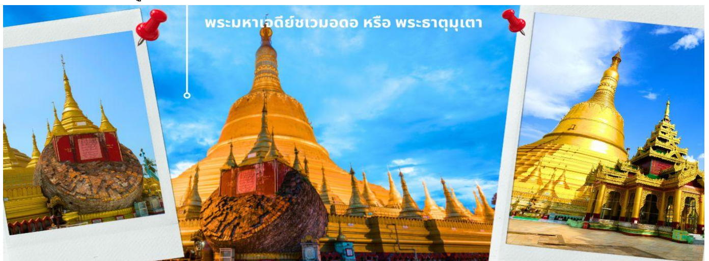
พระมหาเจดีย์ชเวมอดอ หรือ พระธาตุมุเตา

จากนั้นทำท่านกราบนมัสการ พระมหาเจดีย์ชเวมอดอ หรือ พระธาตุมุเตา เจดีย์ที่เป็น 1 ใน 5 สิ่งศักดิ์สิทธิ์สูงสุดแห่งพม่า เจดีย์ชเวมอดอมีชื่อเรียกในภาษามอญซึ่งคนไทยคุ้นเคยกับชื่อนี้คือ พระธาตุมุเตา แปลว่า "จมูกร้อน" เพราะกล่าวกันว่าพระเจดีย์องค์นี้สูงมาก ต้องแหงนหน้ามองจนต้องกับแสงแดด ปัจจุบันเจดีย์ชเวมอดอมีความสูงที่ 114 เมตร เป็นเจดีย์ที่สูงที่สุดในประเทศพม่า ในสมัยพระเจ้าตะเบ็งชเวตี้ ใช้เป็นที่ทำพระราชพิธีเจาะพระกรรณเมื่อครั้งพระองค์ขึ้นครองราชย์ใหม่ ๆ ที่ต้องอยู่ ภายใต้วังล้อมของทหารมอญหลายหมื่นนายที่เป็นศัตรู แต่ก็ไม่ว่าจะทำอะไรพระองค์ได้ ภายหลังพระเจ้าตะเบ็งชเวตี้สามารถยึดพะโคเป็นราชธานีแห่งใหม่ได้