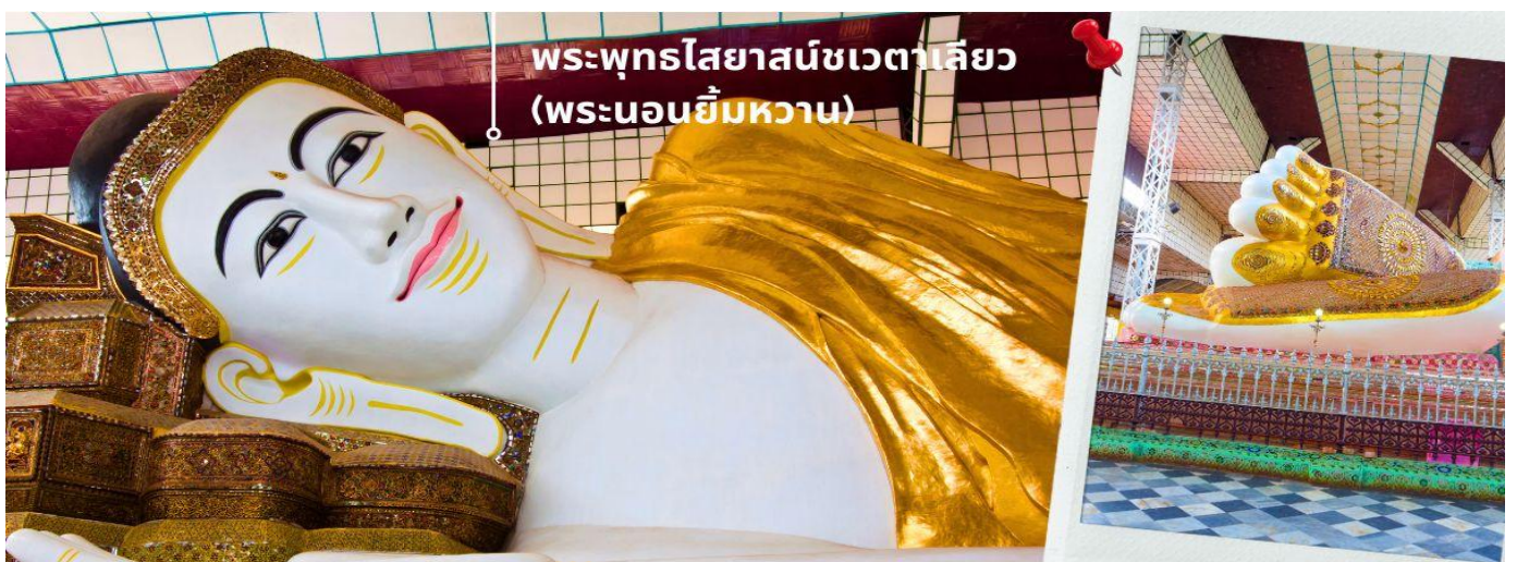
พระพุทธไสยาสน์ชเวตาเลียว (พระนอนยี่มหวาน)

พระพุทธไสยาสน์ชเวตาเลียว เป็นปูชนียสถานศักดิ์สิทธิ์อันดับสองของเมืองหงสาวดี รองจากมหาเจดีย์มูเตตา หรือที่คนไทยรู้จักกันในชื่อ "พระนอนยี่มหวาน" พระนอนชเวตาเลียว หรือ พระพุทธไสยาสน์ชเวตาเลียว มีอายุเก่าแก่กว่า ๑,๒๐๐ ปี คนไทยรู้จักในนาม พระนอนยี่มหวาน เนื่องจากพระพักตร์ของท่านได้รับการวาดตกแต่งไว้อย่างสวยงามพร้อมด้วยรอยยี่มหวาน องค์พระเป็นศิลปะแบบมอญท่านสามารถที่จะเลือกหา เครื่องไม้แกะสลัก ที่มีให้เลือกมากมาย ตลอดสองข้างทางที่จะเดินเข้าไปสักการะองค์พระนอน และสินค้าพื้นเมืองอื่นๆ อาทิเช่น ผ้าพม่า ของที่ระลึกต่างๆอีกมากมาย