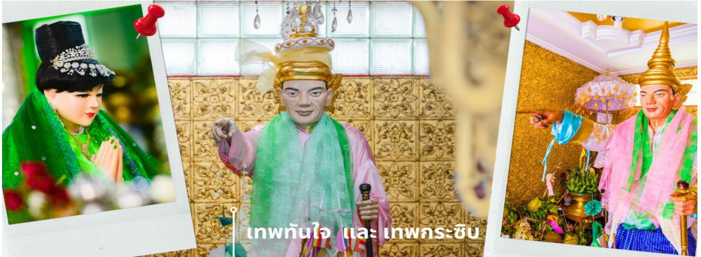
เทพทันใจ และ เทพกระซิบ

C8MR1 ย่างกุ้ง-หงสาฯ-พระธาตุดินทร์แขวน-เจดีย์กลางน้ำลิเรียม 3 วัน 2 คืน บิน 8M (SEP-MAR25)