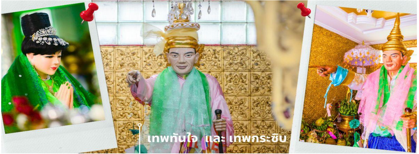
เทพทันใจ และ เทพกระซิบ

C8MR1 ย่างกุ้ง-หงสาว-พระธาตุนรินทร์แควน-เจดีย์กลางน้ำลิเรียม 3 วัน 2 คืน บิน 8M (SEP-MAR25)