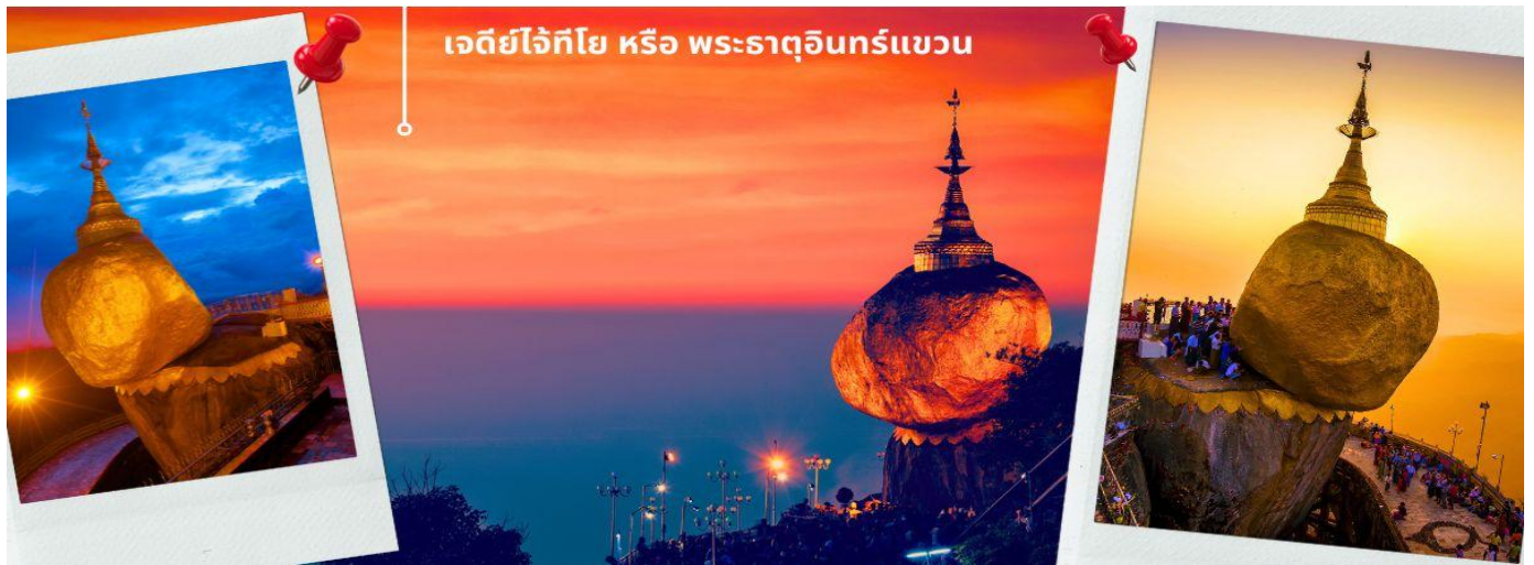
เจดีย์ไจ้ทีโย หรือ พระธาตุนิทรแชน

จากนั้นนำท่านเดินทางต่อสู่ เมืองไจ้โท แห่งรัฐมอญ เมืองเล็ก ๆ ที่ตั้งอยู่ในอำเภอสะเทิม เขตรัฐมอญของประเทศพม่า ไจ้โทเป็นภาษามอญ มีความหมายว่า "หินรูปหัวฤาษี" ซึ่งเป็นที่ตั้งของเจดีย์พระธาตุนิทรแชนที่โด่งดัง และเป็นที่ยึดเหนี่ยวจิตใจของชาวพม่า รวมถึงประเทศเพื่อนบ้านอย่างชาวไทยด้วยเช่นกัน ใช้เวลาเดินทางประมาณ 2.30-3 ชั่วโมง ก็จะถึง คิมปุนแควัมปี เพื่อทำการเปลี่ยนเป็นรถท้องถิ่น (รถบรรทุกหกล้อขนาดเล็กเป็นรถประจำเส้นทางชนิดเดียวที่เราจะสามารถขึ้นพระธาตุนิทรแชนได้) ใช้เวลาเดินทางประมาณ 30-45 นาที จากนั้นท่านจะต้องเดินเท้าเพื่อเข้าสู่ที่พัก เพื่อให้ท่านได้พักผ่อน เก็บสัมภาระ ก่อนที่จะนำท่านกราบมัสการ เจดีย์ไจ้ทีโย หรือ พระธาตุนิทรแชน เชื่อว่าพระธาตุแห่งนี้เป็นที่ประดิษฐานพระเกศาธาตุของพระโคตมพุทธเจ้า ตั้งอยู่บริเวณหน้าผาสูงชันบนยอดเขาไจ้ทีโยอย่างหมิ่นเหม่ เหมือนจะหล่นและทำทลายแรงดึงดูดของโลกโดยไม่ตกลงมา ตามตำนานระบุว่าฤาษีดิสสะเป็นผู้หนึ่งที่ได้รับพระเกศาจากพระพุทธเจ้าและนำมาไว้ในมวยผม ตั้งใจจะนำพระเกศาไปบรรจุไว้ในก้อนหินที่มีรูปร่างคล้ายกับศีรษะของฤาษี ท้าวสักกเทวราช (พระอินทร์) จึงช่วยเสาะหาก้อนหินดังกล่าวจากใต้ท้องมหาสมุทรและนำมาวางไว้บนภูเขา พระธาตุนิทรแชน นับเป็น 1 ใน 5 สิ่งศักดิ์สิทธิ์สูงสุดของชาวพม่า พระเจดีย์องค์นี้เปิดตลอดทั้งคืนแต่ประตูเหล็กที่เปิดสำหรับสุภาพบุรุษที่เข้าไปปิดทององค์เจดีย์เปิดถึงเวลา 21.00น. ส่วนสุภาพสตรี สามารถอธิฐาน และฝากสุภาพบุรุษเข้าไปปิดแทนได้ท่านสามารถเตรียมแผ่นทองคำไปเพื่อปิดทององค์พระธาตุนิทรแชนหรือสามารถเช่าบูชาแผ่นทอง ชุดไหว้ช่องทางวัดก็ได้เช่นกัน