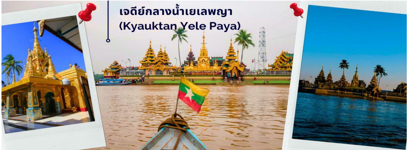
เจดีย์กลางน้ำเยเลพญา (Kyauktan Yele Paya)

นำท่านออกเดินทางสู่ เมืองลิเรียม (ใช้เวลาเดินทางประมาณ 45 นาที) ตาน-ลีน หรือ เซอ้ง ในอดีตไทยเรียก ลีเยม มีชื่อเดิมที่เป็นที่รู้จักกันโดยทั่วไปว่า ลิเรียม เป็นเมืองท่าสำคัญของภาคย่างกุ้ง ประเทศพม่า ตั้งอยู่ปากแม่น้ำอิรวดี อดีตเป็นเมืองท่าชั้นนอกของพะโคหรือหงสาวดี เคยเป็นที่มั่นของทหารโปรตุเกสที่ช่วยเหลือชาวมอญทำสงครามกับพม่าตั้งแต่คริสต์ศตวรรษที่ 16 เจดีย์กลางน้ำเยเลพญา (Kyauktan Yele Paya) เจดีย์นี้สร้างขึ้นบนเกาะกลางน้ำ เรียกอีกชื่อหนึ่งว่า “เจดีย์กลางน้ำ” เป็นที่สักการะของชาวลิเรียม ที่บริเวณท่าเทียบเรือบนเกาะ พร้อมนมัสการพระพุทธรูปทรงเครื่องจักรพรรดิเก่าแก่ ที่ประดิษฐานบนบัลลังก์ไม้แกะสลักปิดทองคำเปลว ที่งดงามมีอายุนับพันปี ซึ่งเป็นที่สักการบูชาของชาวพม่าและชาวต่างชาติ