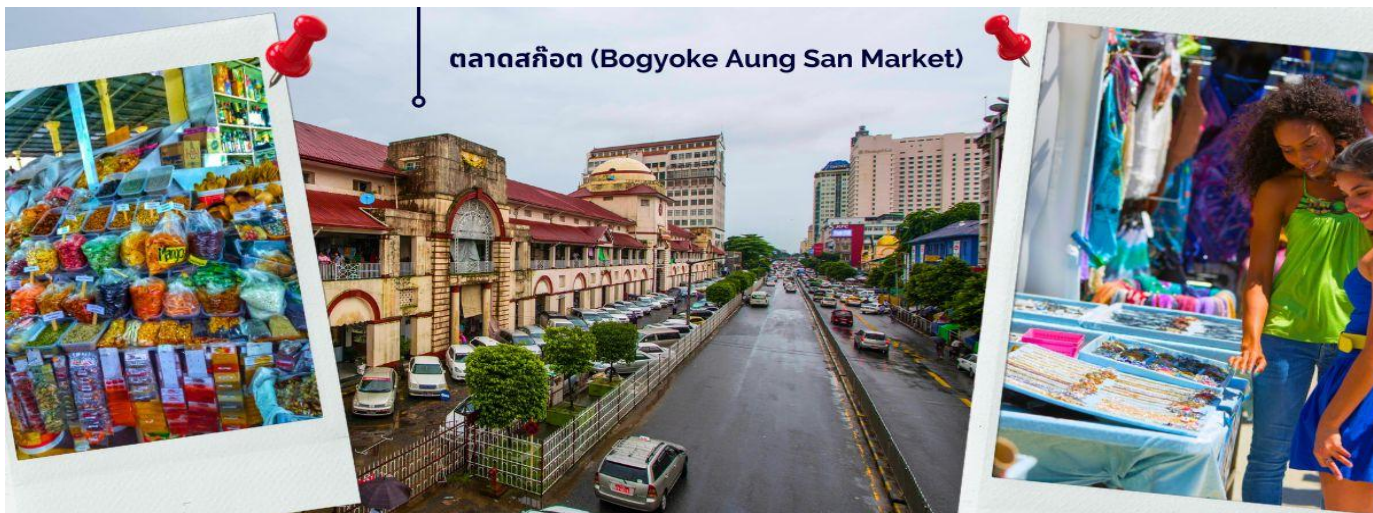
ตลาดสก๊อต (Bogyoke Aung San Market)

ให้ท่านได้มีเวลากับการเลือกซื้อของฝาก ของที่ระลึกต่างๆ ทั้งสินค้าพื้นเมืองที่มีชื่อเสียงของพม่าที่ ตลาดสก๊อต (Bogyoke Aung San Market) นี่คือนตลาดที่ใหญ่ที่สุดในย่างกุ้ง เป็นแหล่งช้อปปิ้งที่มีสินค้าวางขายแทบทุกชนิด เปรียบเสมือนตลาดนัดจตุจักรของบ้านเราก็อาจได้ นอกจากนี้สินค้าพื้นเมืองแล้ว ตลาดแห่งนี้ยังเป็นแหล่งรวมสินค้าประเภทอัญมณีที่เป็นที่รู้จักไปทั่วโลกนั่นคือ หยกพม่า (หากซื้อสินค้าหรืออัญมณีที่มีราคาสูง ควรขอใบเสร็จรับเงินทุกครั้ง เนื่องจากจะต้องแสดงให้เจ้าหน้าที่ศุลกากรหากมีการขอตรวจสอบ)